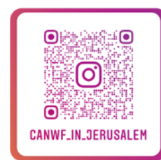
CANWF Instagram 以色列生活大小事、 節日卡片、經文圖與您分享