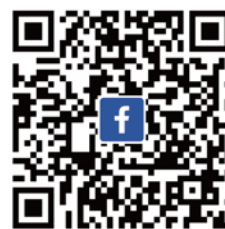
CANWF Facebook 不錯過即時消息與影片