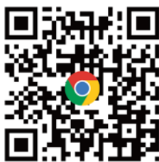
CANWF官方網站 完整資訊都在這 (可到網站下方 訂閱免費電子報)