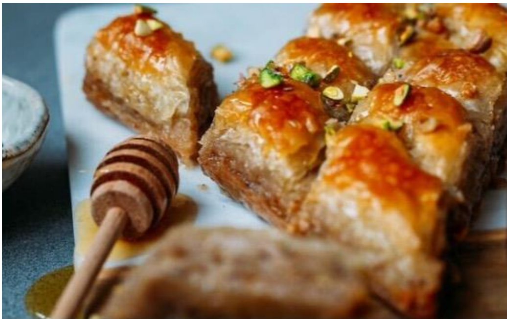
蜂蜜香草磅蛋糕

雖然這是一種加上蜂蜜的蛋糕，但它肯定不是您心想的經典蜂蜜蛋糕，這更好吃。這是簡單但帶有淡淡蜂蜜味的磅蛋糕，不論是飯後享用或當作隔天的早餐，都很受大家喜歡，Barefoot Contessa 商店再次為大家提供了一款受歡迎的食譜。(註：「Barefoot Contessa」為甜點師伊娜·加藤所經營的品牌)