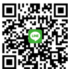
CANWF Line@ 每週以色列新聞及代禱消息