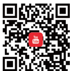
CANWF YouTube 觀看最新影音新聞、今日以色列影片