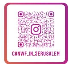
CANWF Instagram 以色列生活大小事、 節日卡片、經文圖與您分享