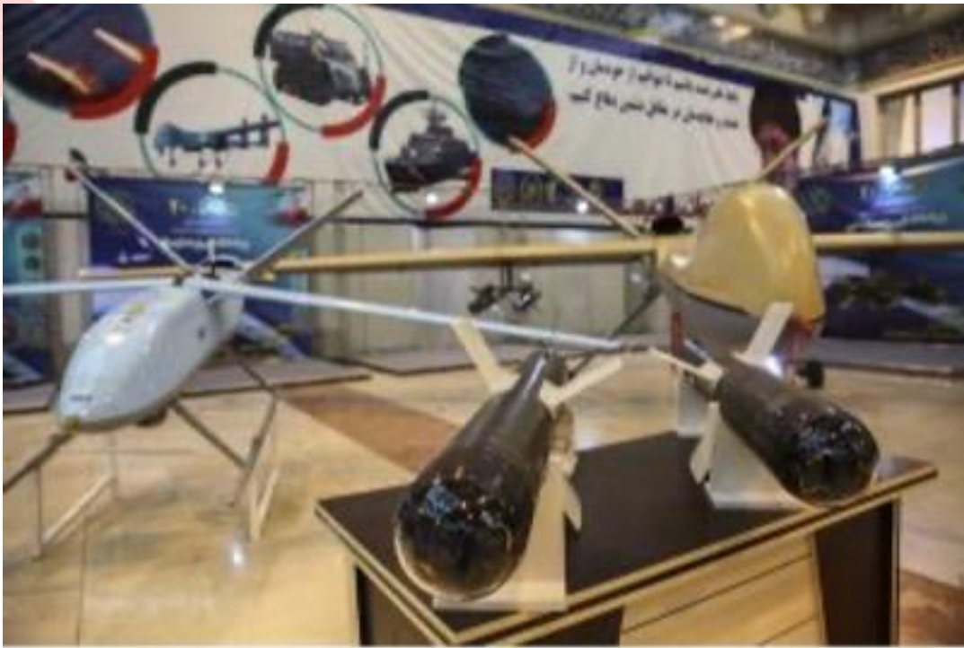
伊朗武器（Sadid-345 精確制導）炸彈和沙赫德（Shahed）無人機

令耶路撒冷及其美國盟友感到不安的是伊朗對其反以色列和反西方活動的回應。借鑑俄羅斯的作法（這在俄羅斯入侵烏克蘭前非常明顯）伊朗人已經學會用半真半假的事實來混淆真相，以實現其目標。