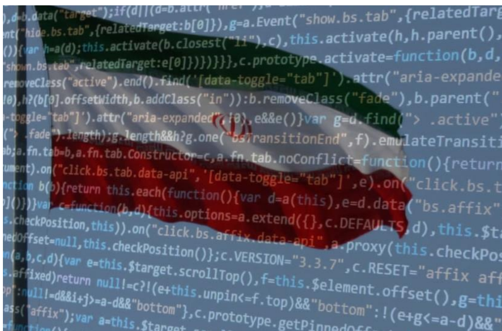
伊朗國旗和網路程式碼 [ 示意圖 ]

「對於面對一些提供千載難逢機會的人員；學者、記者和智庫人士應該要小心應付，並查證他們的身分。」