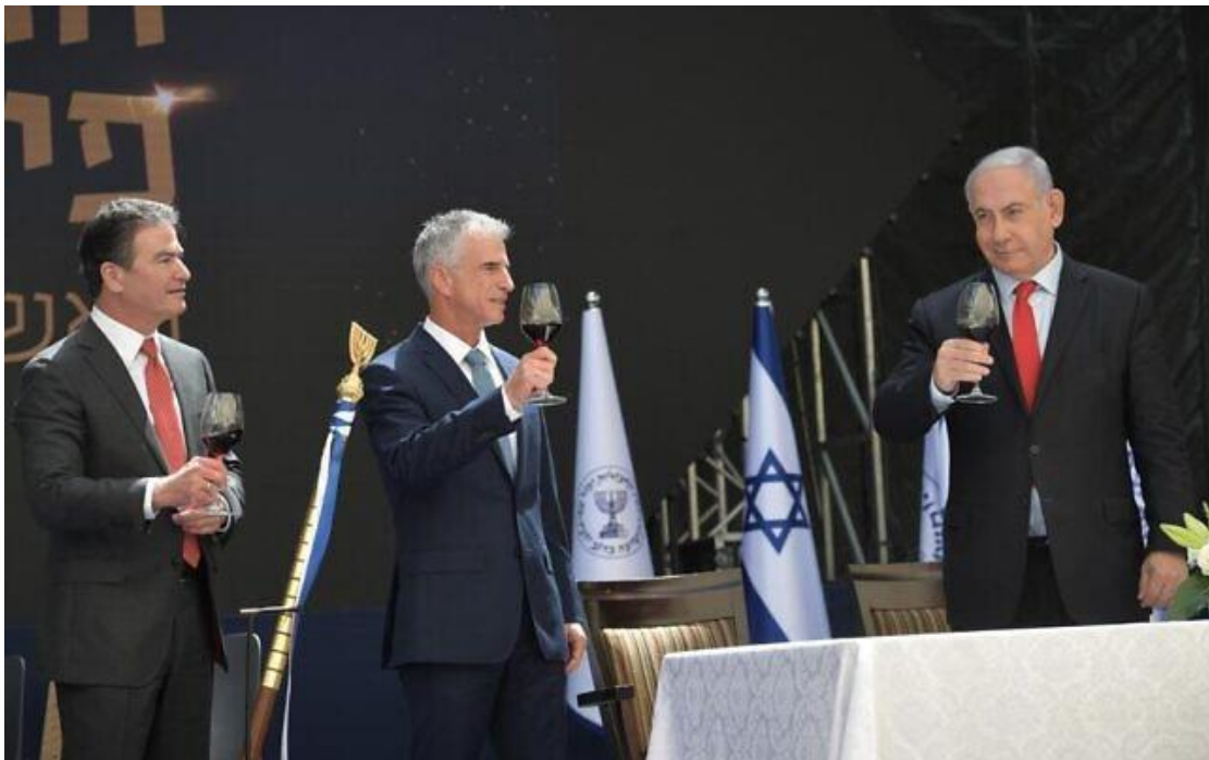
從右到左：2021 年 6 月 1 日，以色列總理納坦雅胡、新任摩薩德局長巴尼亞 (David Barnea) 和卸任的情報局長科恩。

當被問到摩薩德職業生涯結束後，他現在最想念的是什麼，科恩說道：「行動成功完成後的興奮感，這是到哪裡都找不到的感受。」