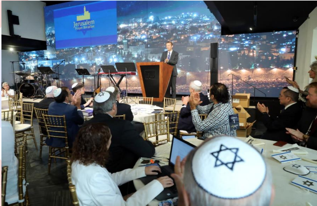
在 2021 年 6 月 10 日週四舉行耶路撒冷祈禱早餐會。