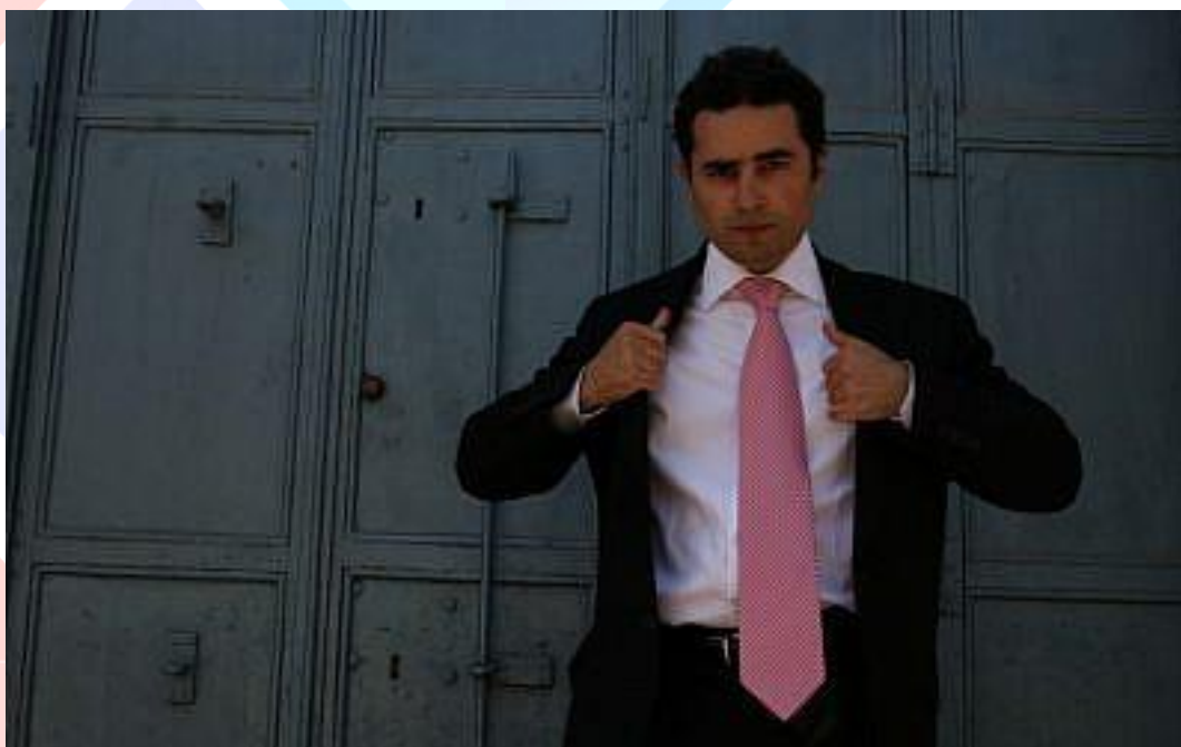
諾爾(Hillel Neuer)

諾爾指出：「毫無一項議程或決議是針對其他國家或衝突、內戰或政治僵局，沒有針對敘利亞的議程，他們國內的醫院、醫療基礎建設一再遭受敘利亞和俄羅斯軍隊刻意的轟炸；也沒有針對飽受戰爭摧殘的葉門相關議程，在葉門有 1800 萬人亟需衛生支援；也沒有關於委內瑞拉的議程，其衛生系統瀕臨崩壞，有 700 萬人迫切需要人道援助。」