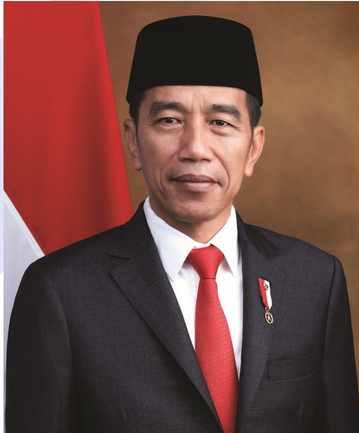
印尼總統佐科威（Joko Widodo）。(Photo: Joko Widodo twitter)

道麗雅還在貼文中呼籲印尼總統佐科威（Joko Widodo）：「希望印尼能夠追隨這些國家（阿聯和巴林等國）的腳步，也與以色列建立外交關係。」