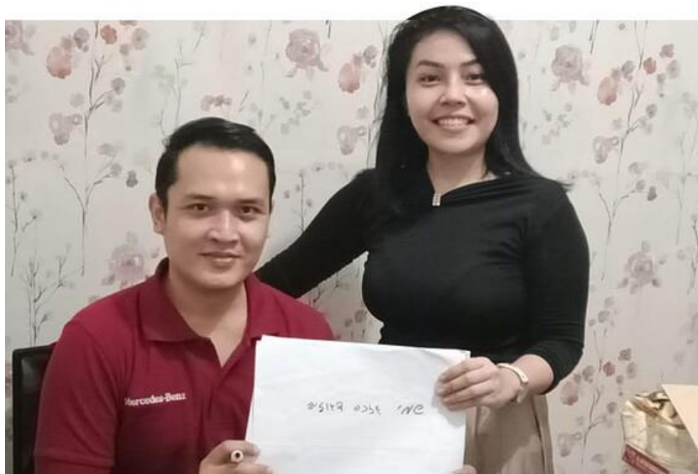
道麗雅和哥哥拿著希伯來文寫的標語。

在新加坡之行的最後一天，道麗雅去到哈巴德之家（Chabad House）禱告，並留下來參加安息日晚餐。「拉比走近我們的桌子，想要認識我是誰，並將我介紹給他的妻子。我告訴他們，我想學希伯來文，他們就推薦線上課程。我還和一名以色列人交換電子郵件，而且通信了一年。在這段期間，我在線上的羅森希伯來文學校（Rosen School of Hebrew）學習希伯來文。