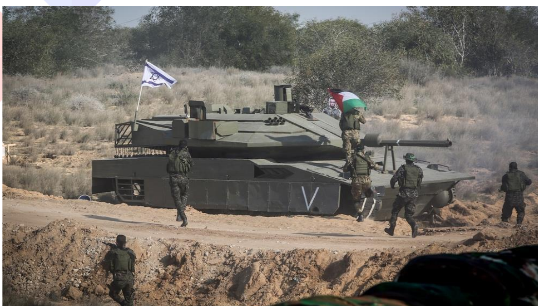
巴勒斯坦軍隊攻擊「複製的」以色列國防軍坦克。

以色列的聯合軍事演習並未針對任何會造成實際威脅的目標敵人，但是哈瑪斯為首的演習明顯是為與以色列及其軍隊抗衡。