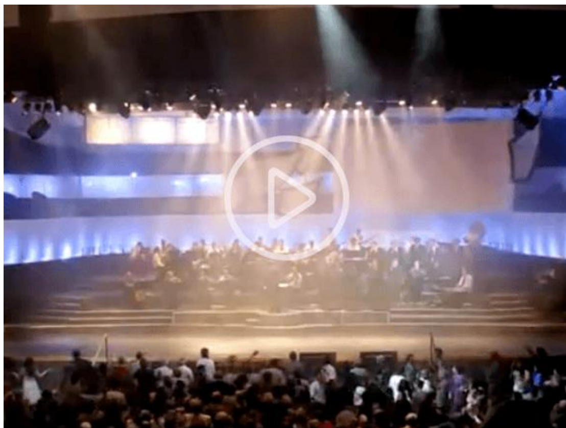
2010 年 ICEJ 住棚節慶典盛會-讓我們歡樂 (Hava Nagila)。

「學校合唱團演唱學校校長教唱的希伯來文歌曲，因為歌曲中傳遞和平的訊息。學校每年最大的活動就是穆斯林新年慶祝活動，在活動中，我們也會演唱像是《手足情深 (Hineh Ma Tov) 「詩篇 133 篇弟兄和睦同居何等善何等美」》和《讓我們歡樂 (Hava Nagila) 》等猶太歌曲。