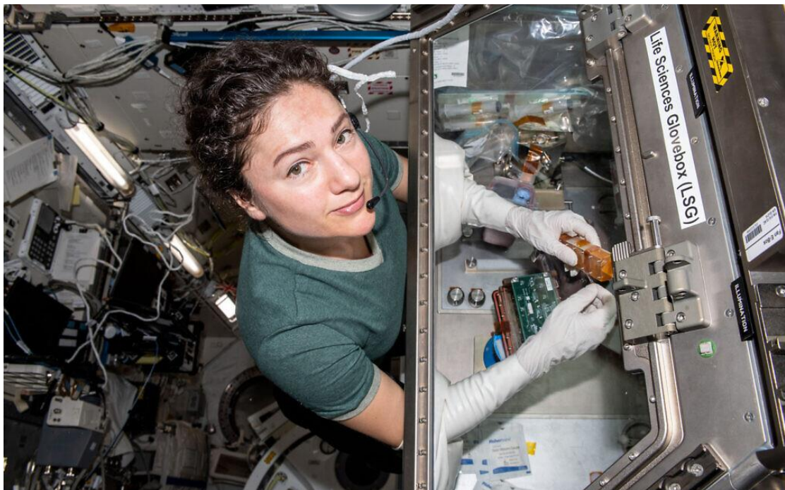
太空人潔西卡梅爾在國際太空站進行一項科學研究。

太空人潔西卡·梅爾在國際太空站進行一項科學研究。NASA 還有另一個實驗，旨在解決世上可供移植器官太少的問題，以及透過重力讓細胞長成器官組織的困難。生物製造設備 (biofabrication facility) 『使用人類細胞去製造的 3D 列印設施』，這個在國際太空站上碰到了一點問題。梅爾印製了心臟細胞和膝蓋半月板軟骨。