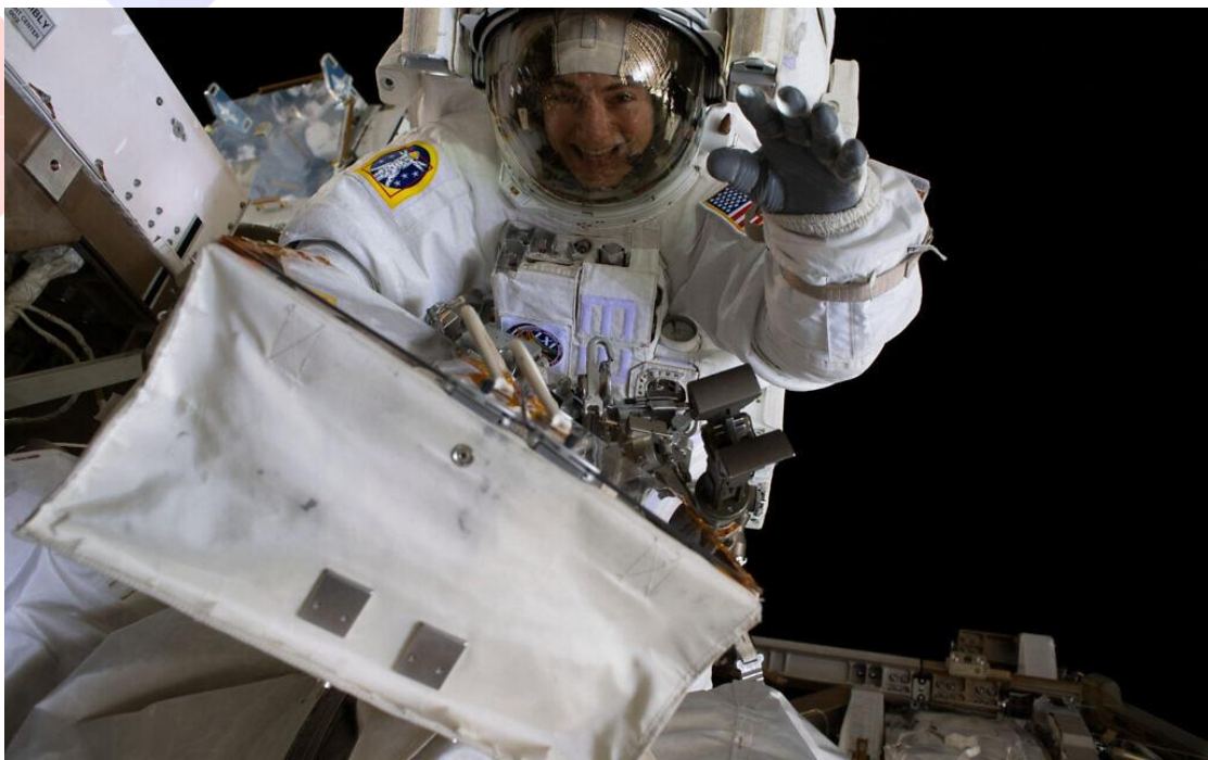
NASA 太空人潔西卡·梅爾在出艙任務中，踏出了三個步伐。

潔西卡說，「這真是超乎甚而比我想像的更令人驚嘆，我的人生都在夢想著上太空，我知此行已對我產生深遠的影響，遠比想像的更叫人驚嘆...當時，我眼前正在發生的事，有一種超現實的感受。當你身在漂浮狀態又從那樣的角度朝下看著地球的時候，你是不可能叫自己的身體冷靜地面對如此的感受，我從未如此開心過，而且七個月裡是一直都很開心。在那裡，我真的覺得好像回家了，那是屬於我的地方。」