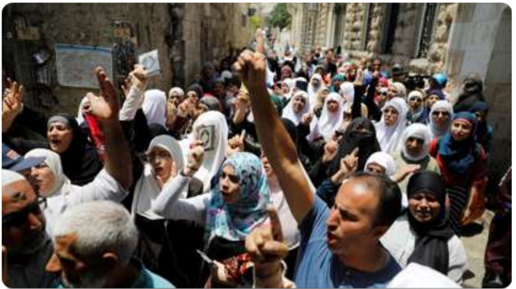
7月20日巴勒斯坦百姓在耶路撒冷老城喊口號抗議以色列政府安裝金屬門偵測器。