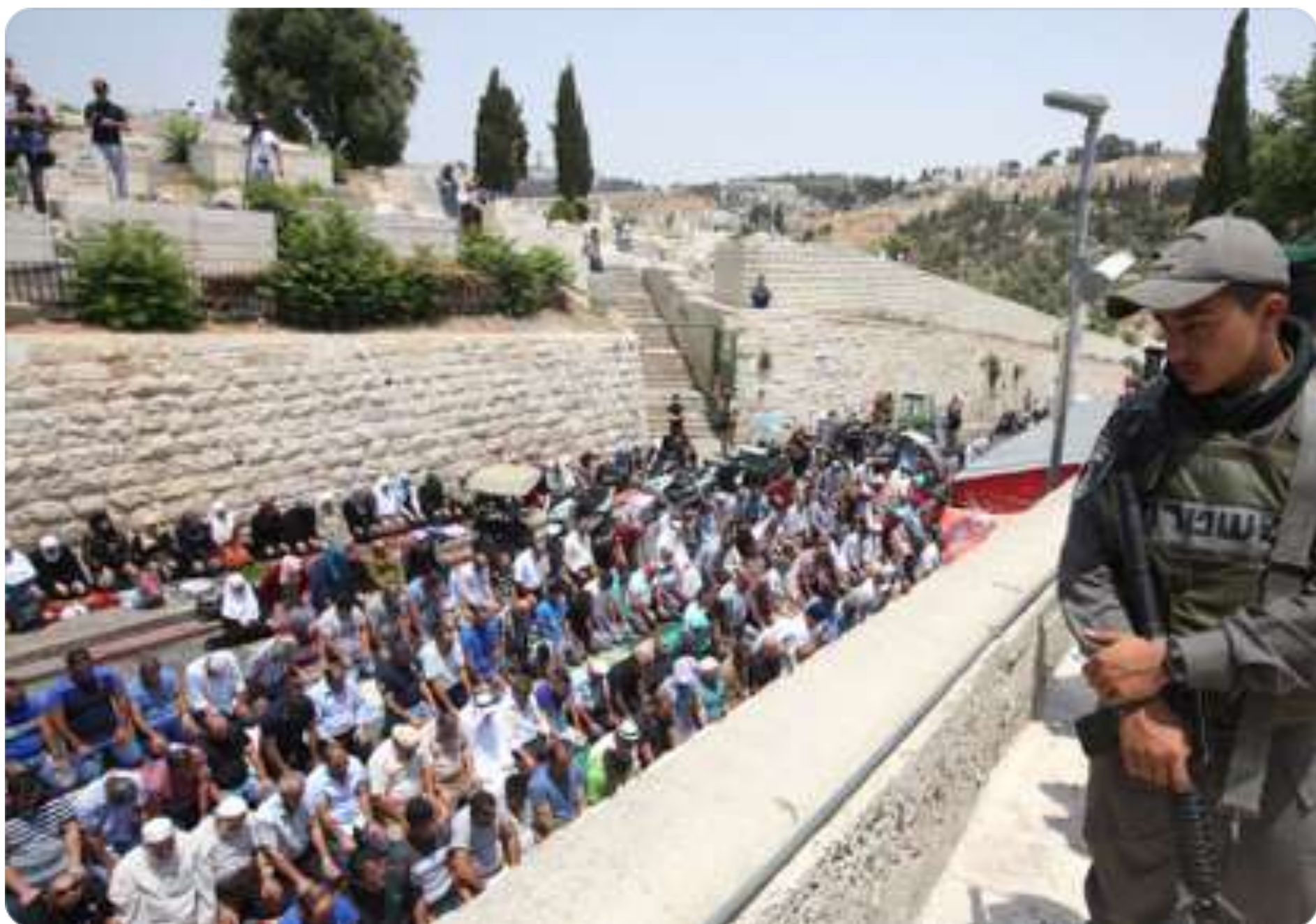
7月20日週四下午，以色列士兵全程監測穆斯林禱告聚集。

以色列政府表示恐攻之後裝設金屬門偵測器，是為了防止潛在的攻擊者再帶著武器進入聖地，持續此恐怖行為。而穆斯林領袖則抗議指責以色列政府裝設金屬門偵測器，全然是歧視穆斯林的行為。