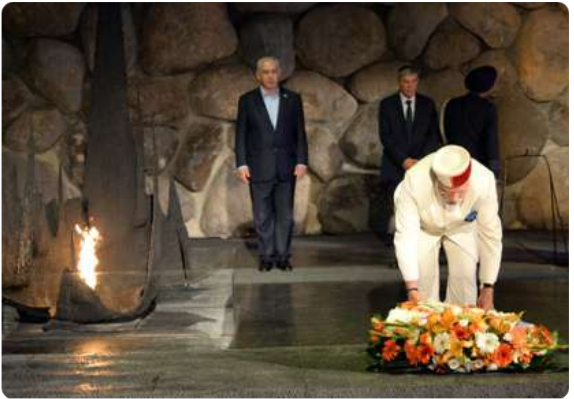
2017年7月4日，印度總理莫迪在猶太大屠殺紀念館追悼廳獻上花環致意。

印度總理莫迪MODI 於7/4週二參觀猶太大屠殺紀念館後表示：這個地方「給世人慘痛的提醒，人類世界中難以言說的邪惡」。猶太大屠殺紀念館館長沙里夫AVNER SHALEV擔任嚮導，為兩位總理進行導覽與解說。他們參觀了受害者名字大廳，在追悼廳參加一場紀念儀式，並參觀了兒童紀念館。