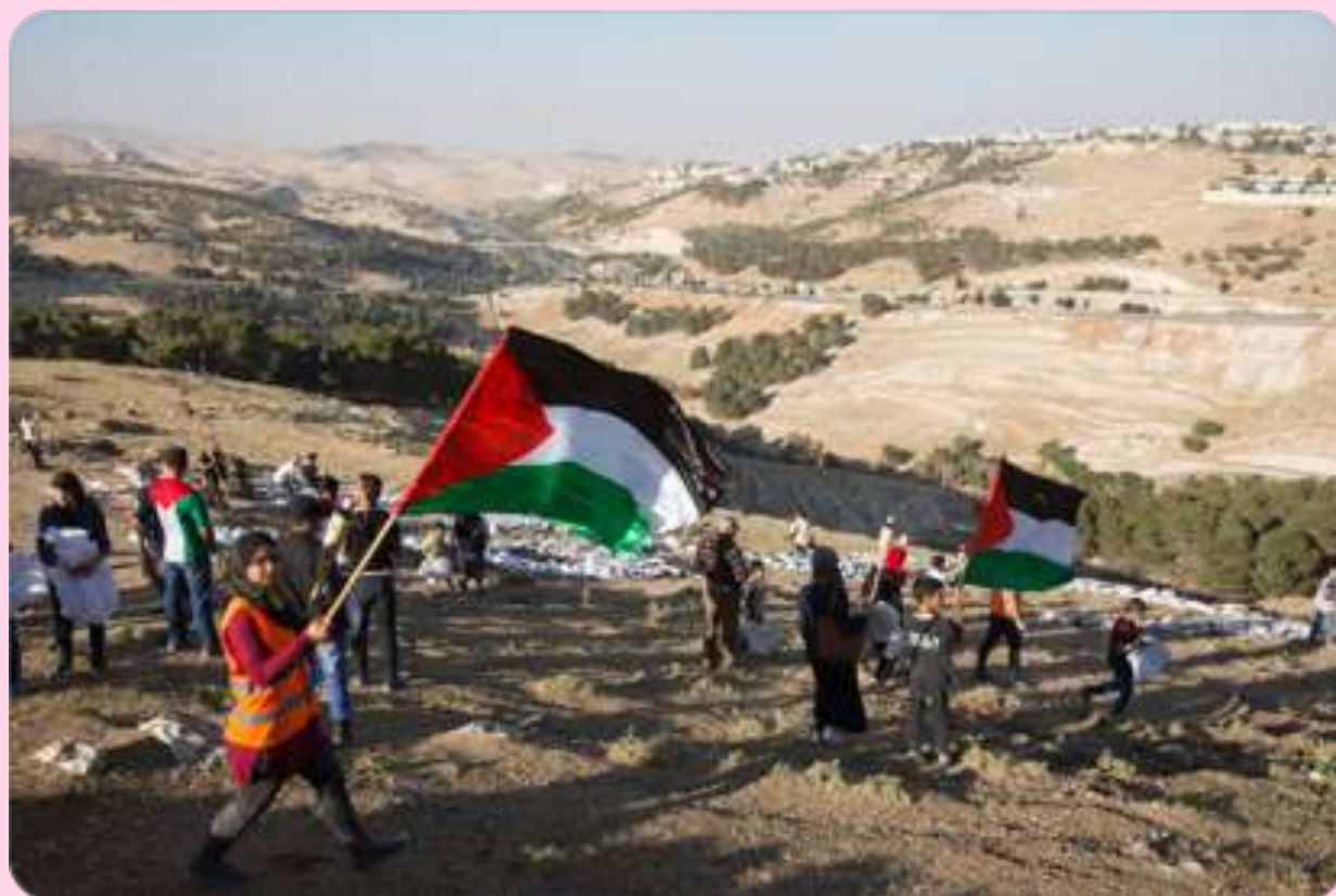
2017年4月28日，巴勒斯坦人在馬埃勒·阿杜明姆（MA'ALE ADUMIM）附近的土地上遊行，為了巴勒斯坦人權而採取的行動主義並不否定承認定居者的人權。