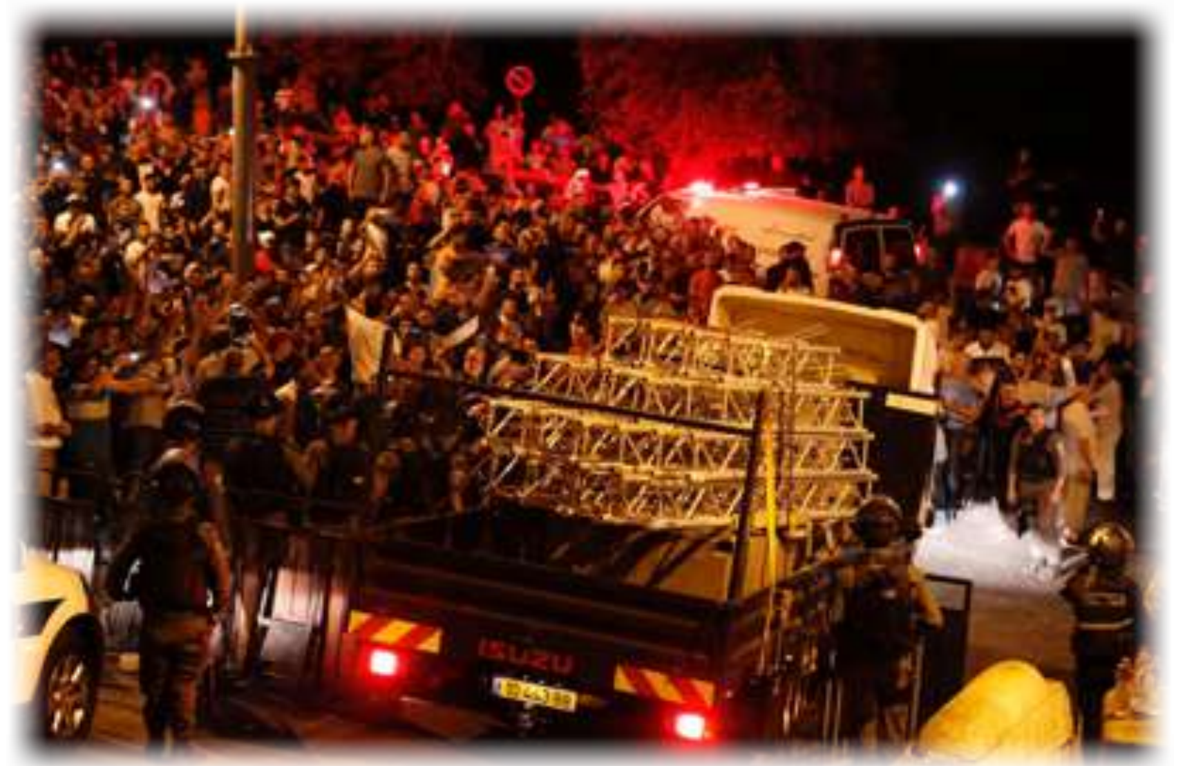
上圖：直至7月27日，在耶路撒冷老城穆斯林信徒與以色列安全部隊之間的衝突，為了阿克薩清真寺議題，已經蔓延了兩週。(CREDIT: OLIVIER FITOUSSI) 下圖：以色列內閣決議將屏障從聖殿山拆除，巴勒斯坦人聚集歡慶。(CREDIT: AHMAD GHARABLI/AFP)