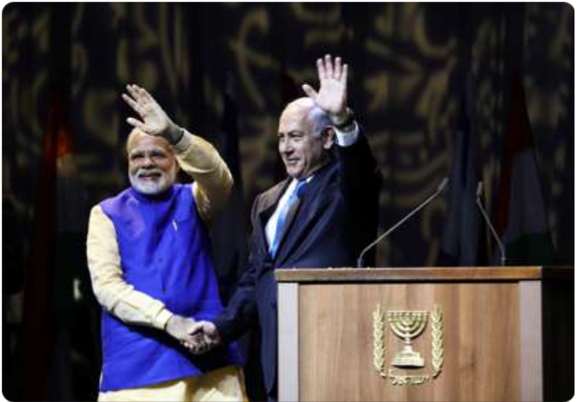
印度總理莫迪MODI（左）與以色列總理納坦雅胡NETANYAHU於2017年7月5日在以色列特拉維夫印度外僑社群舉辦的一場歡迎會中一邊握手，一邊向群眾揮手。

印度外僑社群帶著十足的熱情歡迎莫迪MODI的到訪，在他上台致辭時大聲呼喊他的名字。在以印度語發表為時不短的演說後，針對有以色列公民身分的印度僑民，他宣布他已降低申請印度海外公民卡的種種限制。