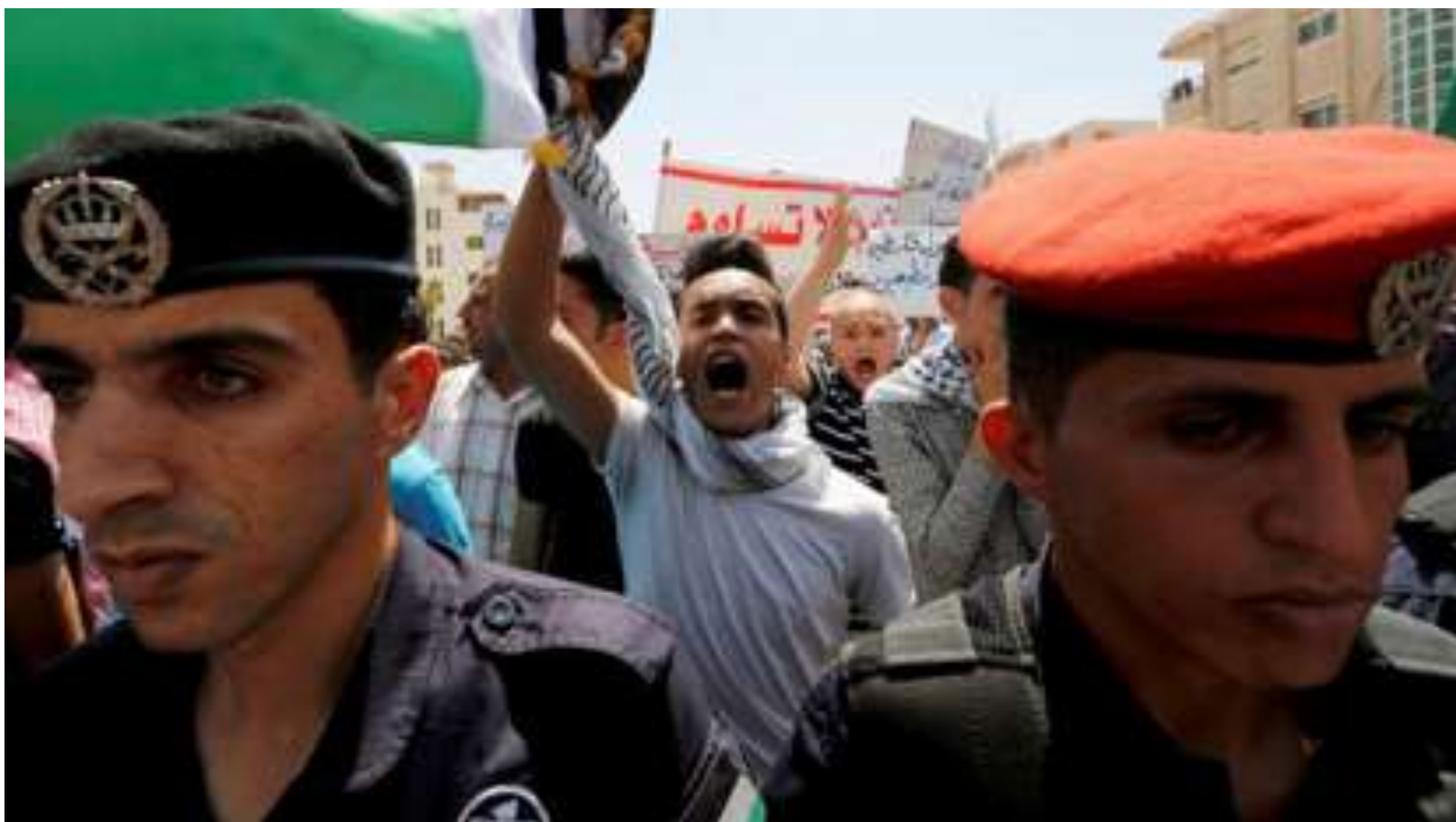
2017年7月28日，示威者在約旦安曼的以色列大使館外遊行並且高唱口號。