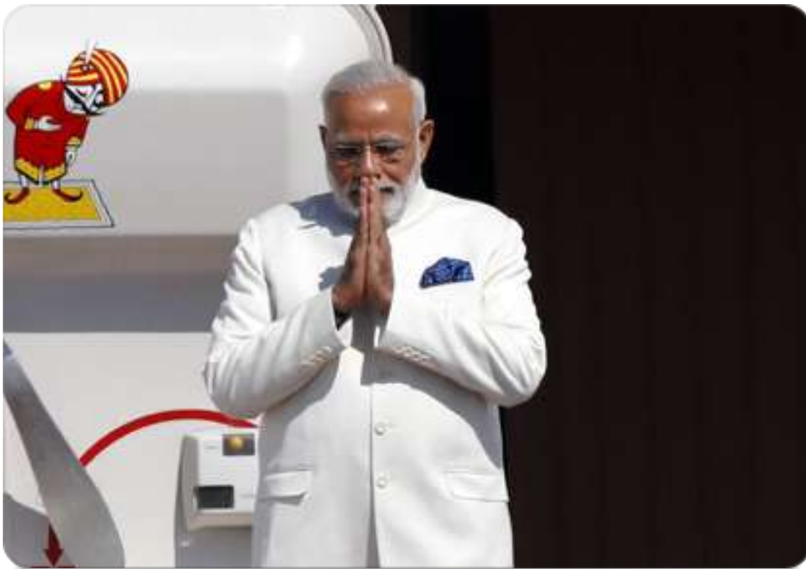
印度總理莫迪於2017年7月4日在專機抵達特拉維夫近郊的本古里昂國際機場時，步出機艙向民眾致意。

莫迪MODI此行第一站便突顯出以色列與印度更緊密合作的關鍵領域，亦即印度在農業科技上的專長。陪同參觀的還有以色列農業部長尤里·艾瑞爾(URI ARIEL)。