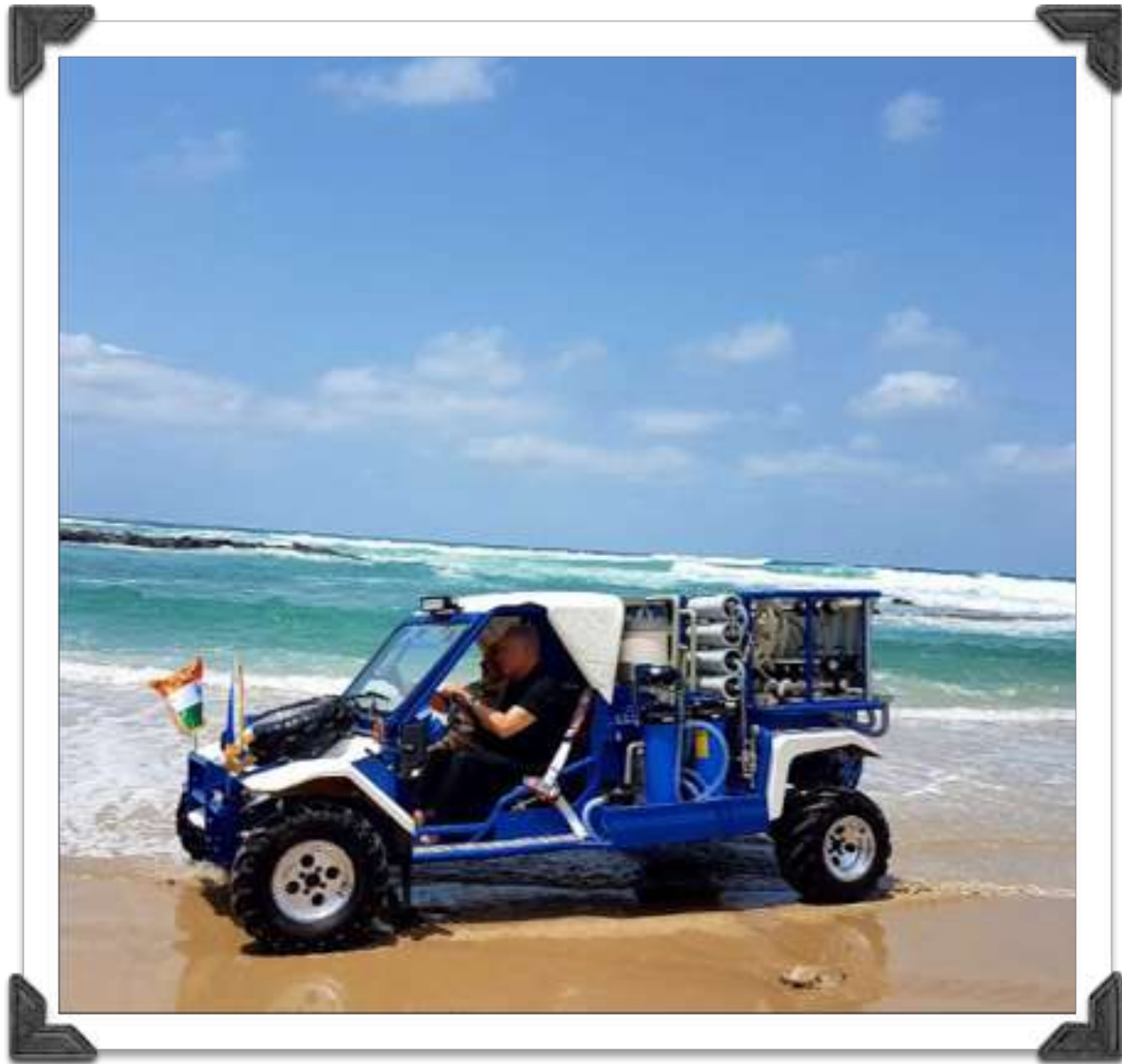
以色列總理納坦亞胡與印度總理莫迪乘坐一輛可移動的海水淡化裝置。