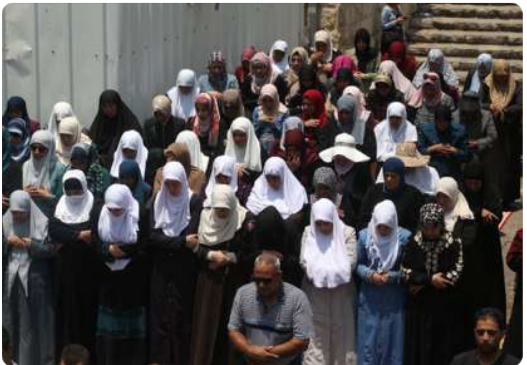
7月20日女性穆斯林教徒也被號召出來在獅子門外禱告聚集。(CREDIT: MARC SELLEM)