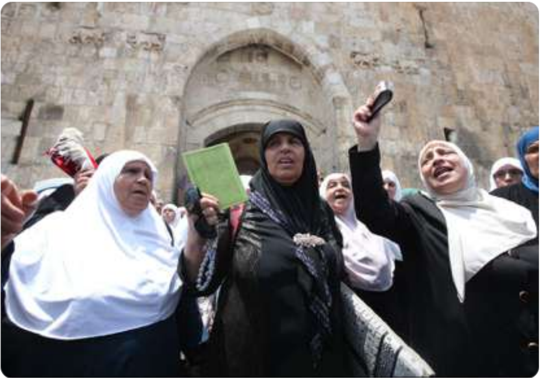
7/20日女性穆斯林在獅子門前抗議呼喊「還我尊貴之所、還我阿克薩清真寺，這裡是我們巴勒斯坦最後一個地方，不拆金屬門探測器，我們絕不離開...」。