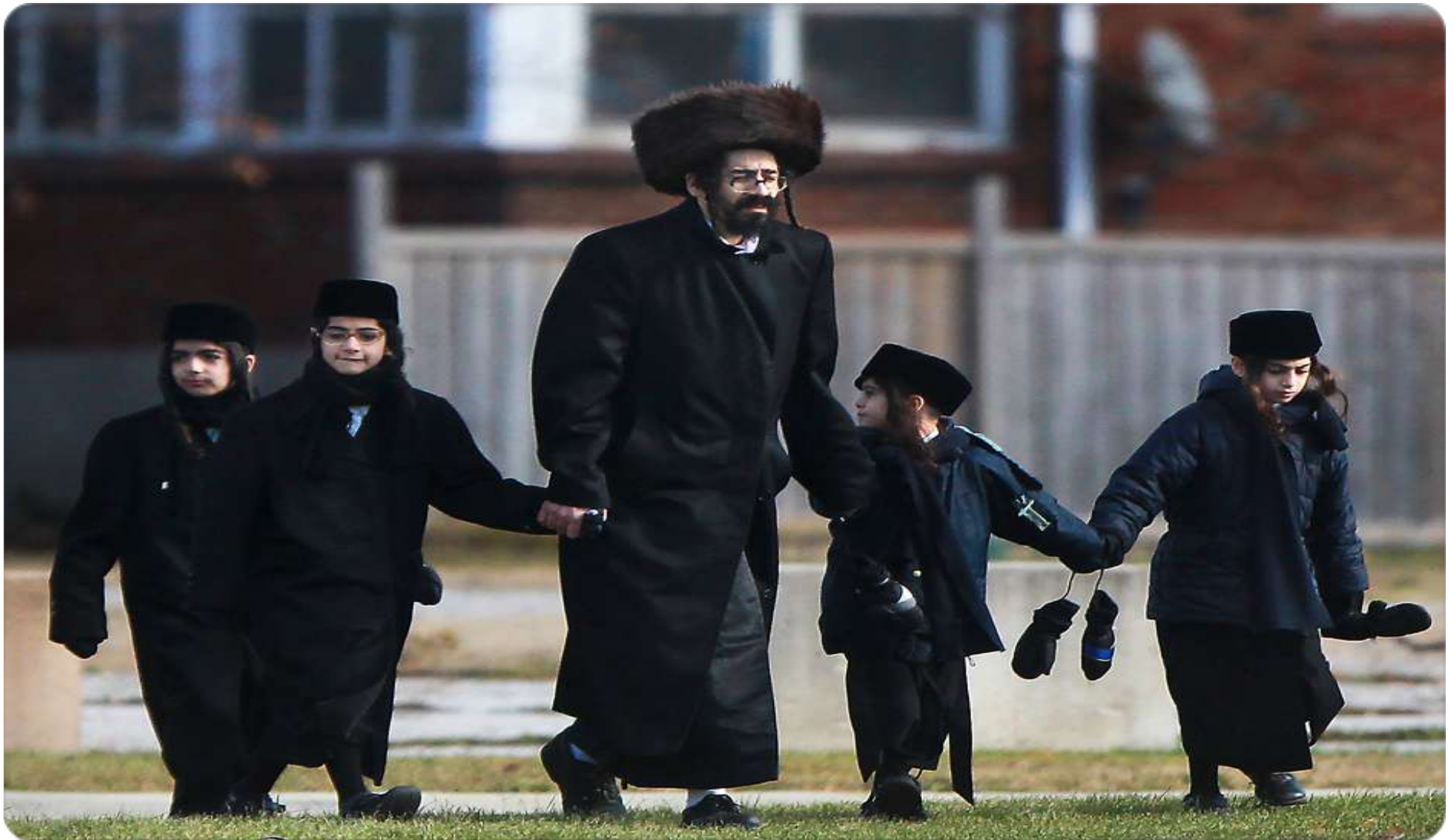
哈雷迪HAREDI正統猶太教父親牽著四個孩子，孩童教育不僅在以色列受到考驗，在加拿大也是如此。