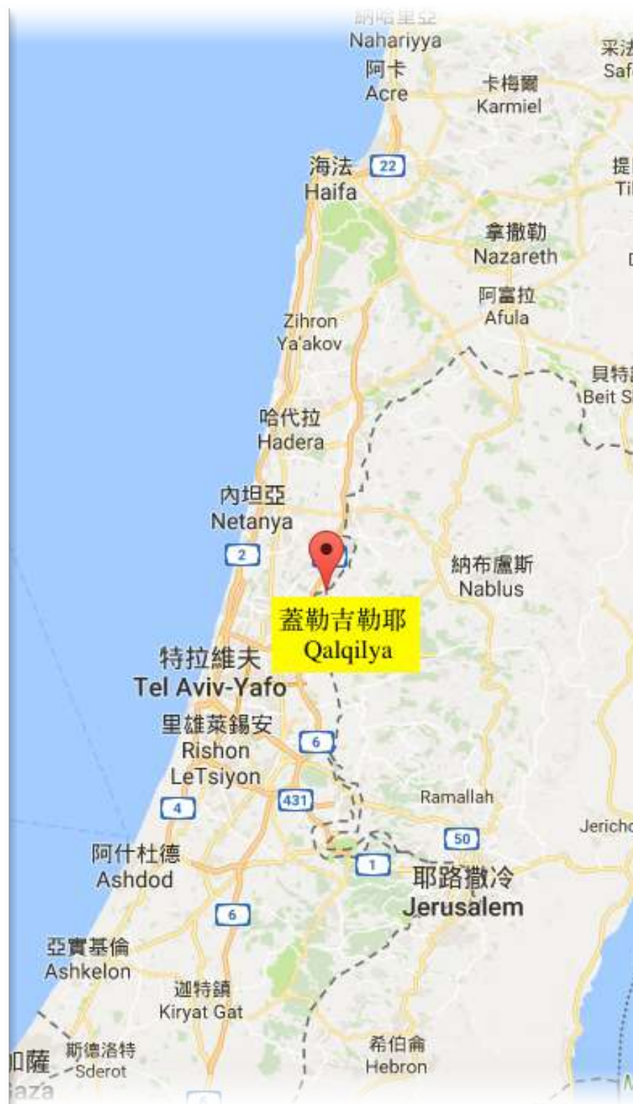
蓋勒吉利耶屯墾區 SETTLEMENT QALQILYA 或稱蓋勒吉勒耶屯墾區 SETTLEMENT QALQILYA