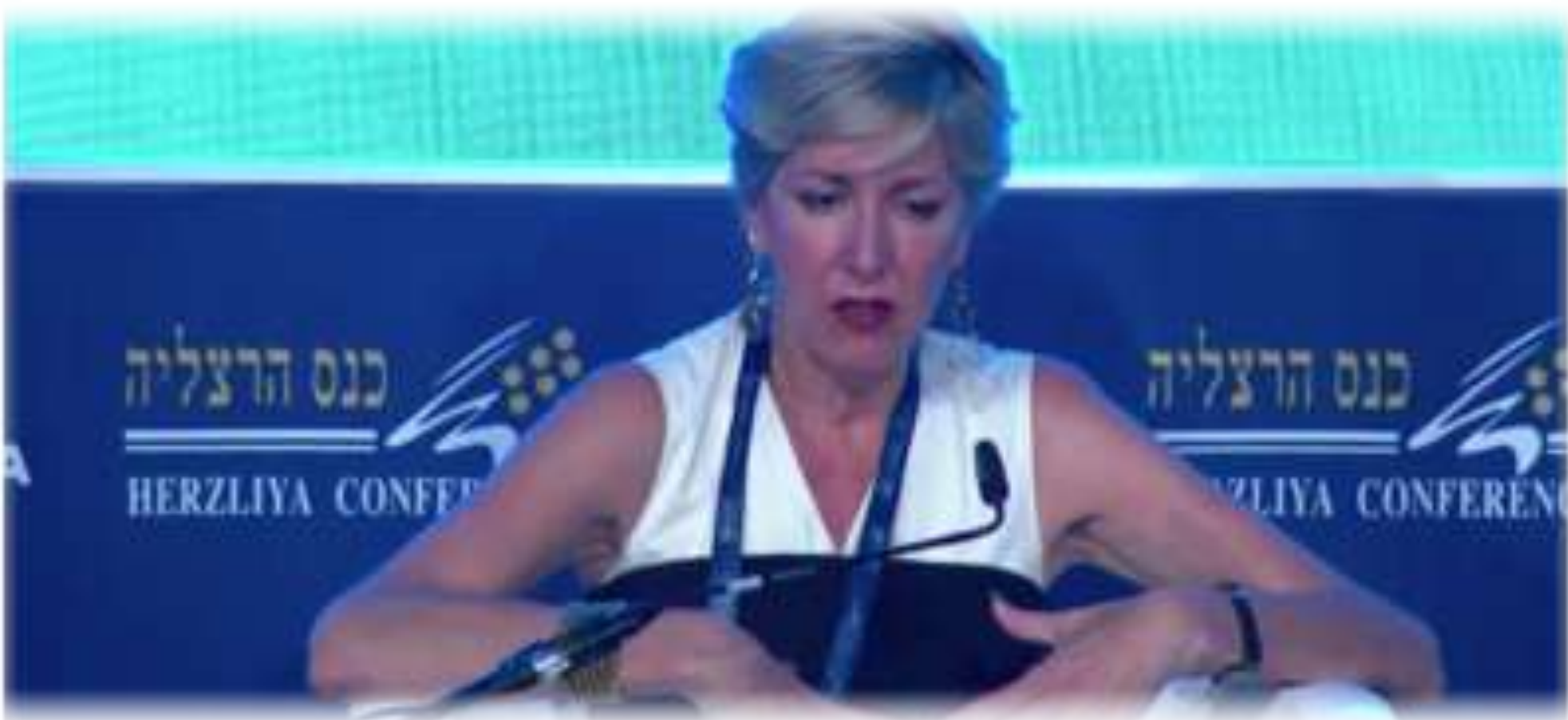
2017年赫茲利亞會議 HERZLIYA CONFERENCE