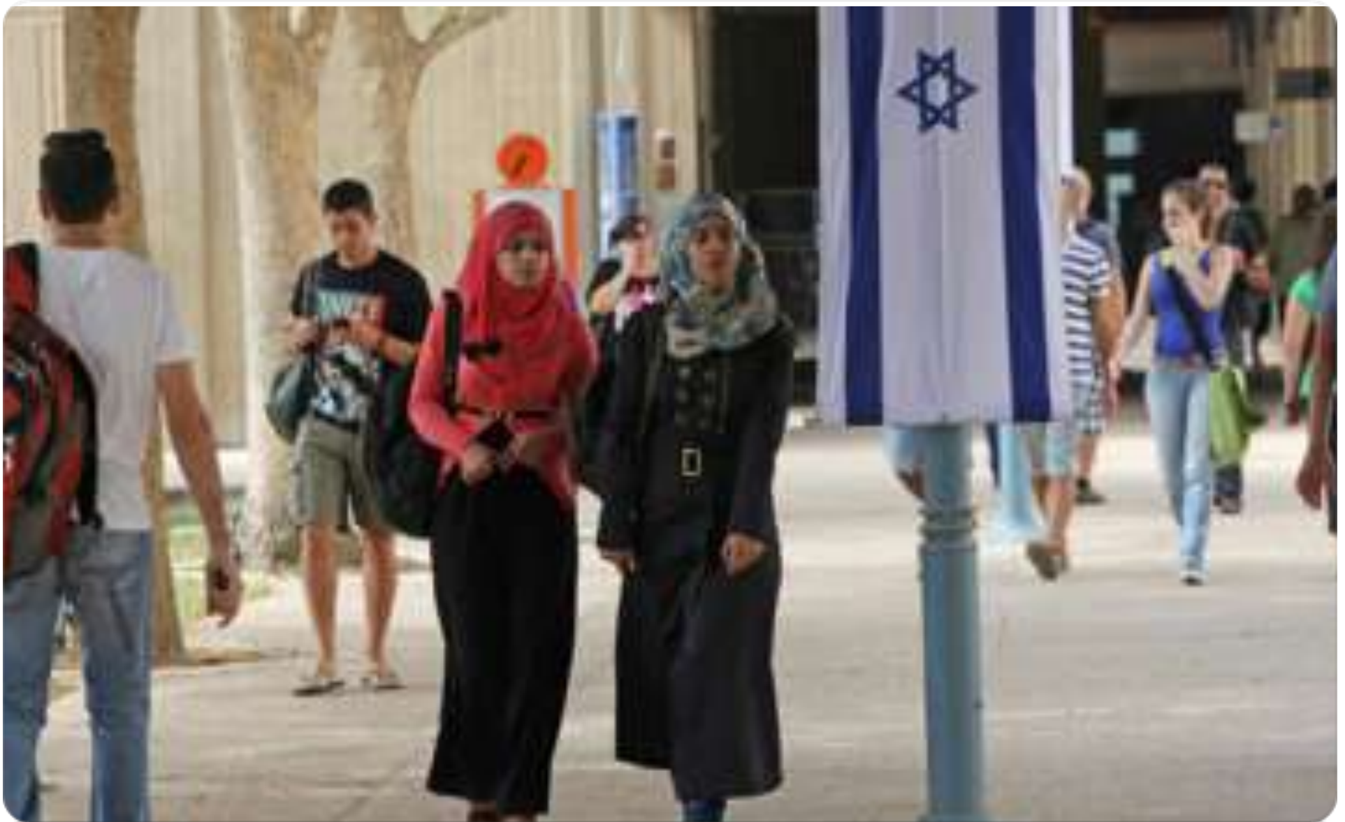
位於以色列別示巴的本·古里安大學，以色列籍阿拉伯人中學習本科學位的女性佔總學生人數的72%。