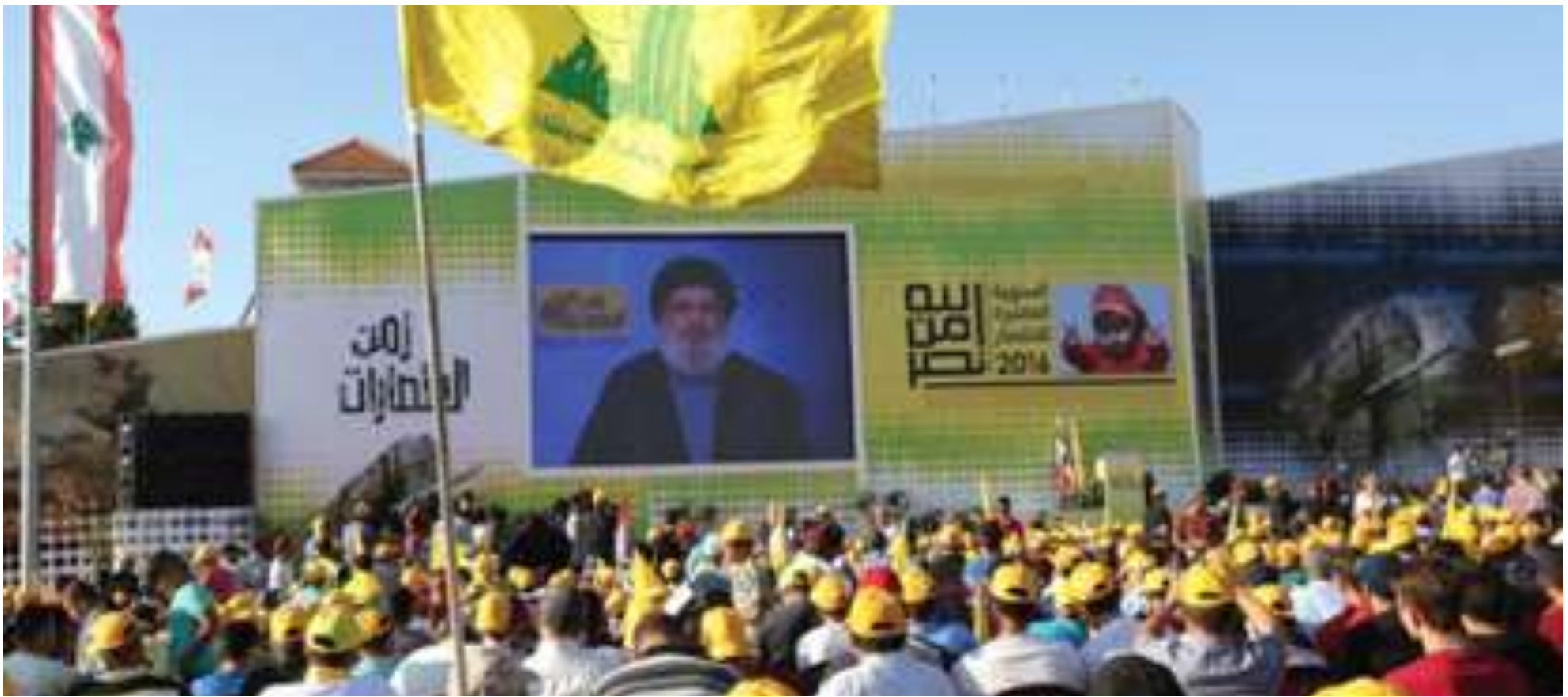
2016年8月13日黎巴嫩南部賓特·吉貝爾(BINT JBEIL)城市，支持真主黨領袖哈珊·納斯魯拉(HASSAN NASRALLAH)的黎巴嫩民眾在「與以色列之役滿10週年集會」上，透由視頻聽取真主黨領袖的聲明。