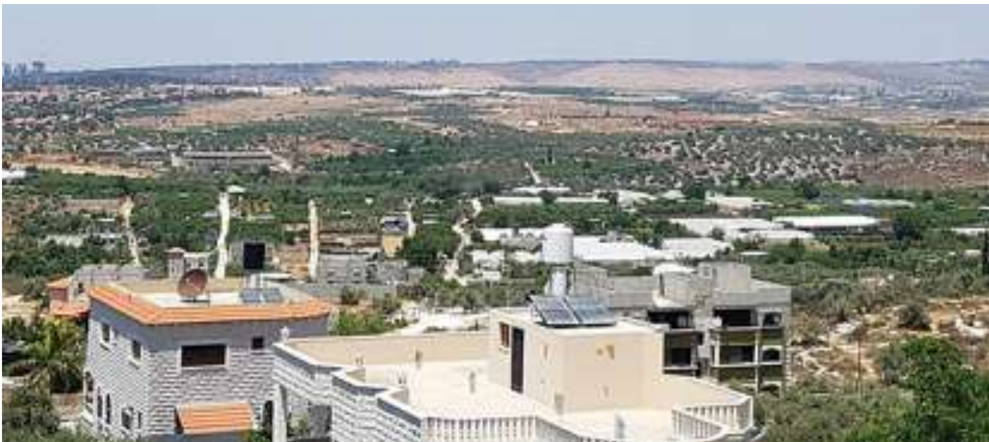
蓋勒吉利耶市 قلقيلية QALQILYA