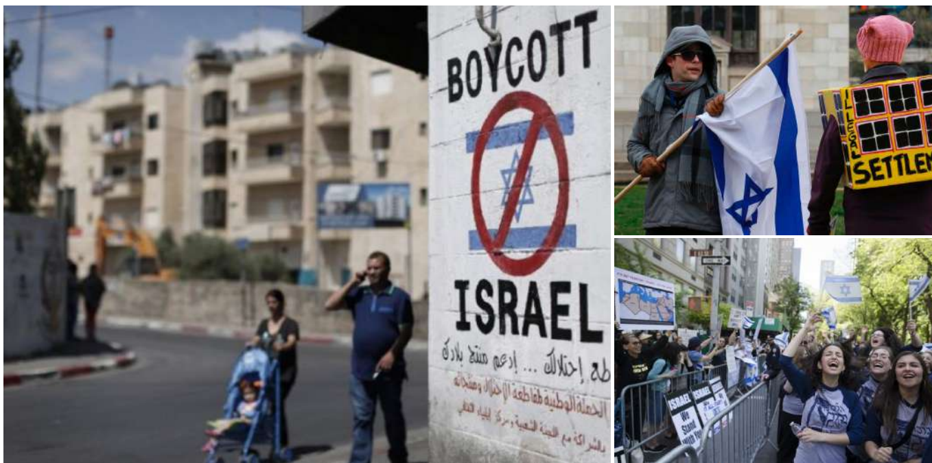
巴勒斯坦人迎面走來，我們看到了在伯利恆牆上，明顯抵制以色列的標誌。