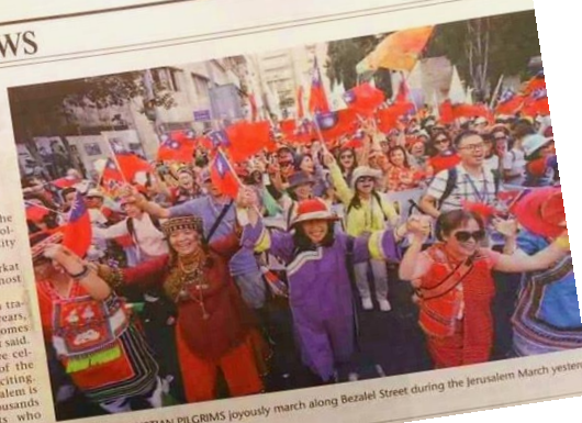
TAWANESE CHRISTIAN PILGRIMS joyously march along Bezalel Street during the Jerusalem March yesterday.