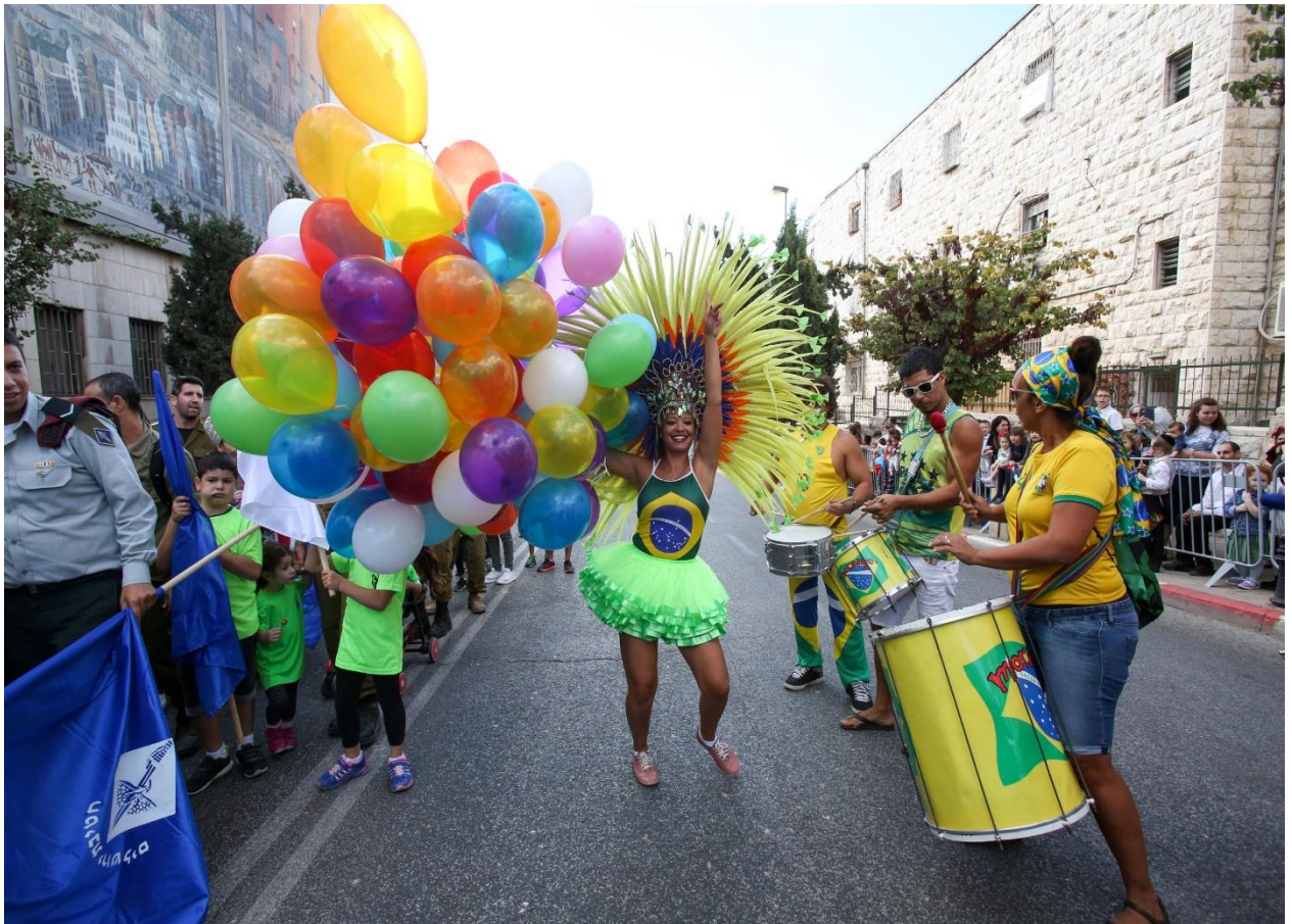
巴西基督徒於耶路撒冷遊行歡慶住棚節。

耶路撒冷市長尼珥·巴爾卡特(Nir Barkat)表示，他很興奮每年都能主辦此活動，市長表示「耶路撒冷遊行的傳統可以回溯到逾60年前，隨著時間流轉，活動變得越來越令人興奮。並且今年我們慶祝耶路撒冷城的統一，所以顯得更加令人興奮。在此住棚節假日期間，耶路撒冷接待幾十萬名訪客與觀光客，他們享受該城市的神奇力量、美侖美奐的觀光勝地以及獨一無二的景緻。」