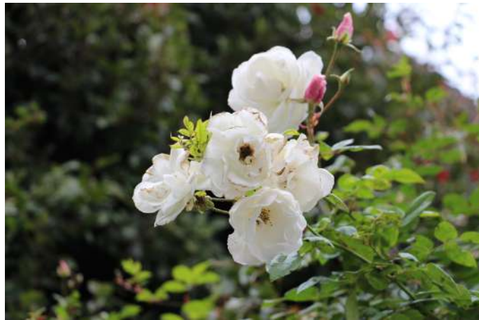
拍攝於耶路撒冷。

親愛天父，我們為著以色列 255 個城市禱告，主的靈運行在所有城市當中，使少年人見異象、老年人做異夢；父神，祢使用教會說預言，翻轉城市，凡求告主名的必要得救。我們將特拉維夫這座城市帶到耶穌面前，特拉維夫是人口販賣居高不下的城市，我們真大大得罪祢，求祢在這個如同所多瑪、蛾摩拉的城市當中做王掌權，赦免我們的罪，洗淨我們，耶穌的羔羊寶血潔淨這座城市與人心，在主大而明顯的日子未到以前，願以色列百姓更多地回轉歸向祢，父神，祢揀選雅各歸自己，揀選以色列特作自己的子民。我們仰望祢，求祢也釋放更多愛以色列的心給祢的百姓。願華人教會更多地認識以色列、愛以色列，好叫父祢的心得滿足，我們得蒙悅納。禱告奉耶穌基督聖名祈求，阿們。