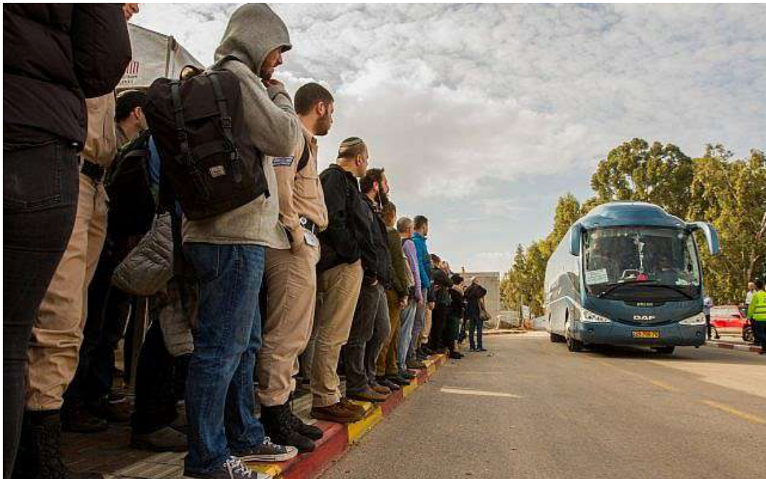
以色列人在貝特耶霍什瓦(Beit Yehoshua)火車站等候前往特拉維夫的公車，照片攝於2018年2月19日。

一份針對全國各城市的研究報告顯示出 最致命的居住地、繳稅最多的城市 以及用水量最多的地方