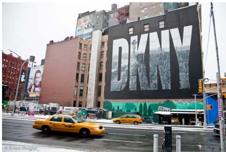
「Donna Karan New York」品牌廣告。

在時尚圈內被譽為「第七大道女王」（Queen of Seventh Avenue）的唐娜·凱倫，在 1980 年代掀起了一番革新職業女性穿搭的浪潮。