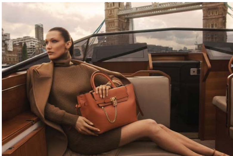
超模貝拉·哈蒂德（Bella Hadid）演繹「Michael Kors 2022 秋冬系列」。

麥可·寇爾斯是一位備受推崇的時裝設計師，以精品配件與成衣系列聞名。他的作品融合都會感與奢華風格，展現歷久彌新的優雅魅力。寇爾斯也被認為是最早將女性成衣推向大眾市場的設計師。