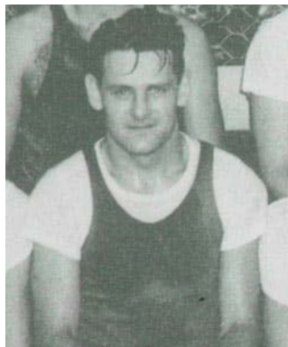
1946 年，奧西·謝克特曼（Ossie Schectman）。

波多洛夫昔日並非明星球員或知名教練。他只是一位擁有法律學位，並以公正著稱的管理者。然而 1949 年，正是在他的領導下，BAA 與 NBL 完成合併，成立 NBA。他協助聯盟擴張規模、穩定經營困難的球隊，並推動多項創新制度，包括大學選秀制度，以及後來著名的 24 秒進攻時限。這些改革加快了比賽節奏，也讓籃球賽變得更精彩，更具觀賞性。