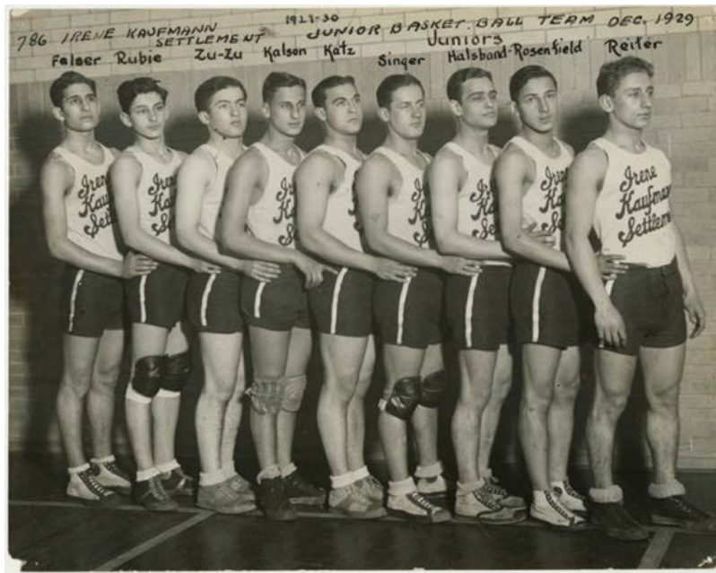
1929 年 12 月，艾琳·考夫曼移民安置中心（Irene Kaufmann Settlement）青少年籃球隊。

差不多在同一時期，1891 年，詹姆斯·奈史密斯博士（Dr. James Naismith）在麻薩諸塞州春田市的基督教青年會（YMCA）發明了籃球。這是一項為冬季設計的室內運動，所需器材極其簡單：只需要有一顆球、兩個籃框，以及一座體育館就足夠。這項運動迅速透過 YMCA、移民安置中心，以及後來的猶太青年會傳開，而這些機構，也正是猶太移民社群生活的核心。