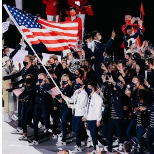
蘇·伯德隨美國隊進入東京奧林匹克體育場。

今天的籃球，早已和 SPHAS 的年代，或瑞德·奧爾巴赫執教塞爾提克的時代截然不同。如今的 NBA 是一個全球化聯盟，球員更高大、更強壯，而涉及的資金規模更是驚人。