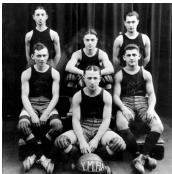
「南費城希伯來協會」（SPHAS）球隊成員

對猶太球迷而言，看著這些球隊不斷贏球，所帶來的意義不只是娛樂。那更像是一種對抗反猶主義的無聲回應。同時證明猶太人也可以堅任與有競爭力，同樣也能成為真正的美國人和其他任何人並無不同。