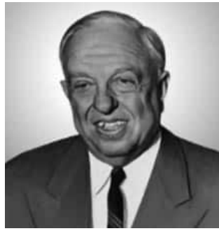
莫里斯·波多洛夫（Maurice Podoloff）。

乃狄克州紐哈芬（New Haven）的猶太裔律師莫里斯·波多洛夫（Maurice Podoloff）擔任 BAA 首任主席，之後也成為 NBA 歷史的首任總裁。