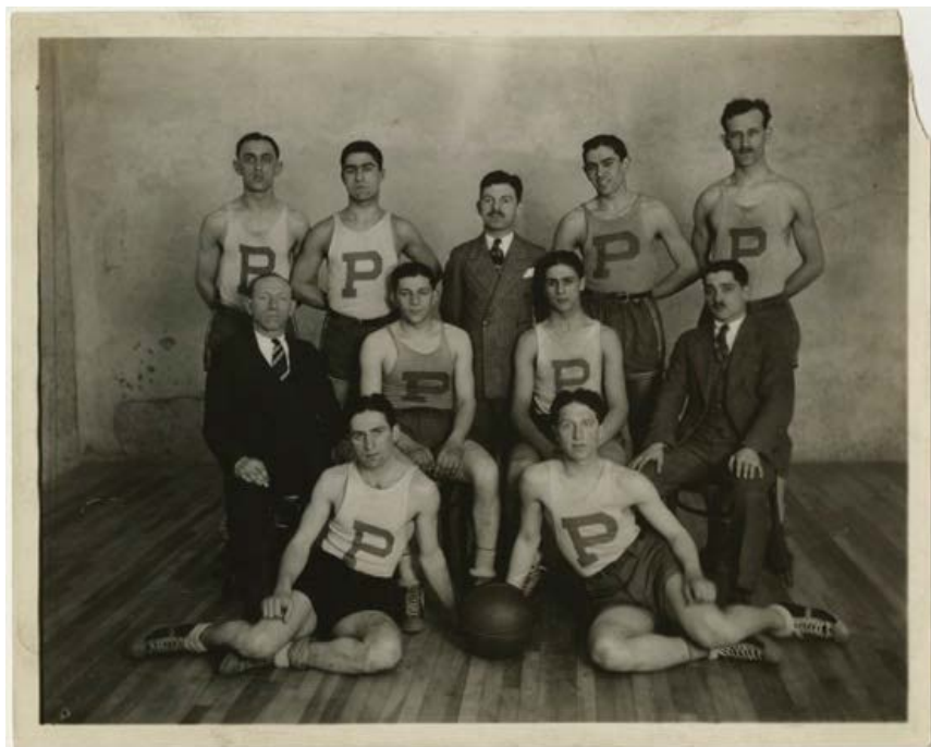
1927 年 4 月，全國猶太青年會（Y.M.H.A.）籃球錦標賽亞軍隊。照片背面文字寫著：「1926-1927 年，新澤西州帕特森（Paterson, N.J.）YMHA。」

到了 1910 和 1920 年代，猶太孩子已不再只是隨興地在街頭打球，他們開始在美國東北部各城市組織自己的球隊、聯盟以及週末錦標賽。不久之後，他們陸續加入紐約旋風隊（New York Whirlwinds）、特倫頓老虎隊（Trenton Tigers）以及費城勇士隊（Philadelphia Warriors）等球隊。