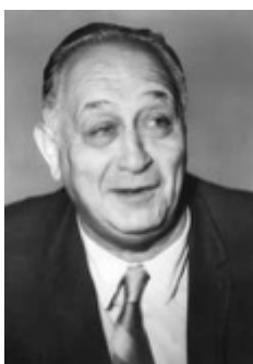
艾迪·戈特利布（Eddie Gottlieb）。

戈特利布的猶太移民身分，深深影響他對籃球的看法與願景。他曾說：「籃球是一項任何人都能參與的運動，不論高矮也不論貧富，人人都能參與，而這就是它能夠長久存在的原因。」對戈特利布這樣的移民而言，籃球不只是一項運動，更是猶太人在美國追求機會的一種象徵。