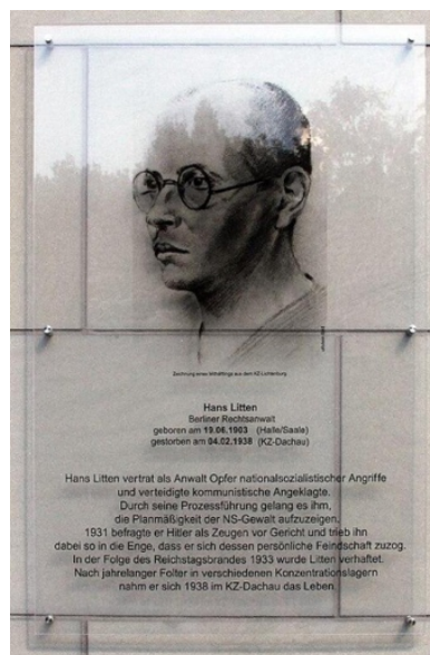
柏林漢斯·里頓紀念牌匾

雖然漢斯·里頓在囚禁中死去，甚至遠早於納粹邪惡計畫徹底實現的時刻，但他留給後世的形象（儘管數十年來大多被忽略）卻是一位無懼挑戰社會中最黑暗且最暴力的人，里頓是一位不惜一切代價也挺身對抗不公不義的人。