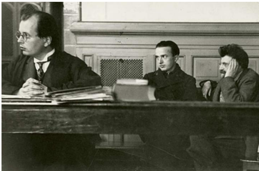
法庭上的漢斯·里頓律師。

漢斯·里頓在深植於他內心的正義感驅使下，他不只是反對希特勒和他的政黨而已；他也會對抗任何挑戰或踐踏無辜德國人權利的人。舉例來說，在盤問希特勒的兩年前，里頓曾試圖指控柏林警察總長卡爾·茨吉貝爾（ Karl Zörgiebel，註：此人厭惡納粹，後來也被納粹吊銷護照）煽動謀殺，因為該警察總長曾向抗議者發動過殘酷鎮壓，但這項指控最終並未成立，而這只是這位年輕律師在他短暫卻頗受矚目的職業生涯中，所採取的眾多法律行動之一。