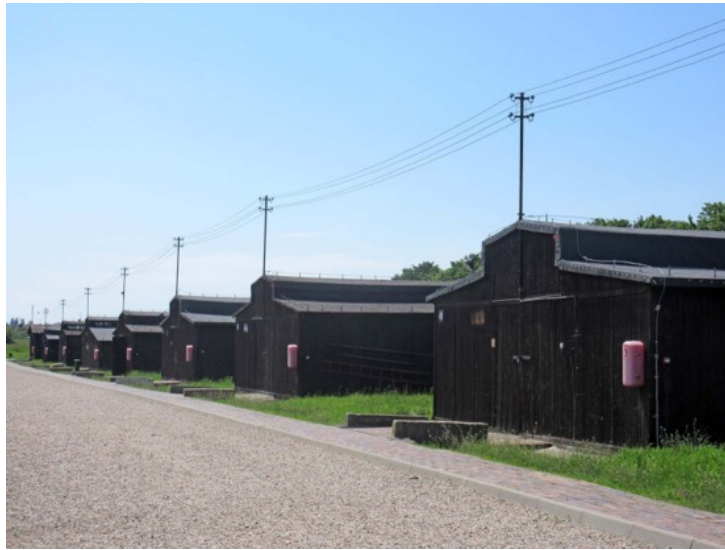
馬伊達內克集中營。