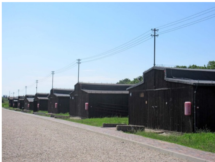
馬伊達內克集中營。

被納粹強迫勞動的猶太人，被迫參與馬伊達內克集中營的建造工作。1941 年 12 月，納粹在盧布林街頭逮捕了超過 300 名猶太人，其中 150 人被送入該營，成為第一批猶太囚犯。在馬伊達內克的槍決刑場與毒氣室中，總共至少有 63,000 名猶太人被殺。