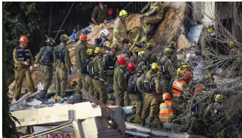
2026年4月6日，伊朗導彈擊中以色列北部地區「海法」的一棟建築物，造成嚴重破壞，至少兩人死亡。圖為以色列救援人員在現場進行搶救。

而且如果停火只是暫時降溫，但國際間仍未處理伊朗對荷姆茲海峽的控制權與通行限制，那麼荷姆茲海峽未來還是會被當成政治與戰略手段，而關於航運保費、能源風險溢價與全球市場波動也有反覆出現的可能。