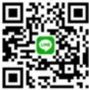
CANWF Line@ 每週以色列新聞及代禱消息