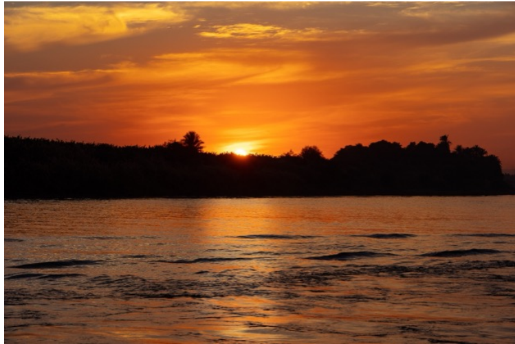
尼羅河的落日景色。