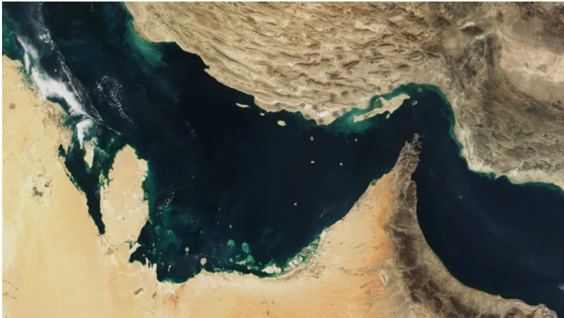
阿拉伯灣、荷姆茲海峽和阿曼灣的衛星影像

值得注意的是在近日，美國一再對外釋出「與伊朗接觸進展良好」的訊號，甚至也因此暫緩「部分」原定升級的軍事打擊，試圖讓外界相信局勢仍有透過談判降溫的可能；但伊朗方面至今並未接受這套說法，反而公開否認雙方正在進行正式會談。這使得所謂「談判進展」目前更像是一種美國主導的政治訊號，而非被雙方共同確認的外交突破，也讓戰爭的後續走向依然停留在高度不確定的情況中。