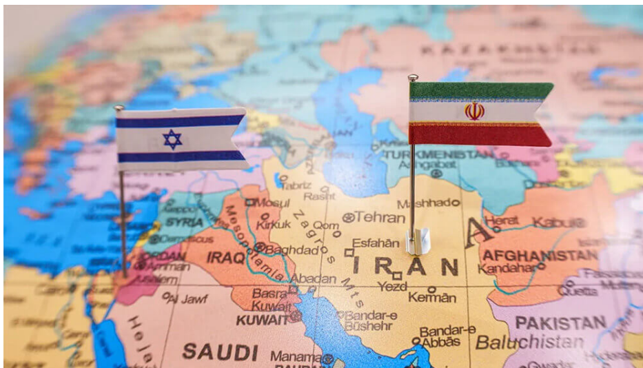
地圖上的以色列與伊朗國旗。

深層敵意，因此「伊朗越打海灣，海灣就越認同以色列」這種推論，從社會與民意層面看，並不成立。