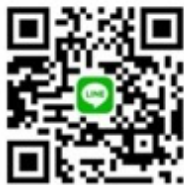
CANWF Line@ 每週以色列新聞及代禱消息