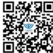
CANWF 官方網站 完整資訊都在這 (可到網站下方 訂閱免費電子報)