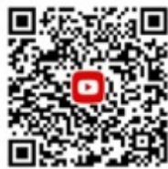
CANWF YouTube 觀看最新影音新聞、今日以色列影片