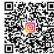
CANWF Instagram 以色列生活大小事、 節日卡片、經文圖與您分享