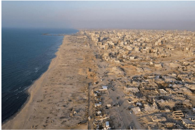
2025 年 10 月 23 日，空拍圖，加薩市被摧毀的建築景。

截至 2025 年 10 月 24 日止，美國、英國、德國、法國、阿聯酋、澳大利亞、加拿大、賽普勒斯、丹麥、約旦、希臘等國已向 CMCC 派駐人員。