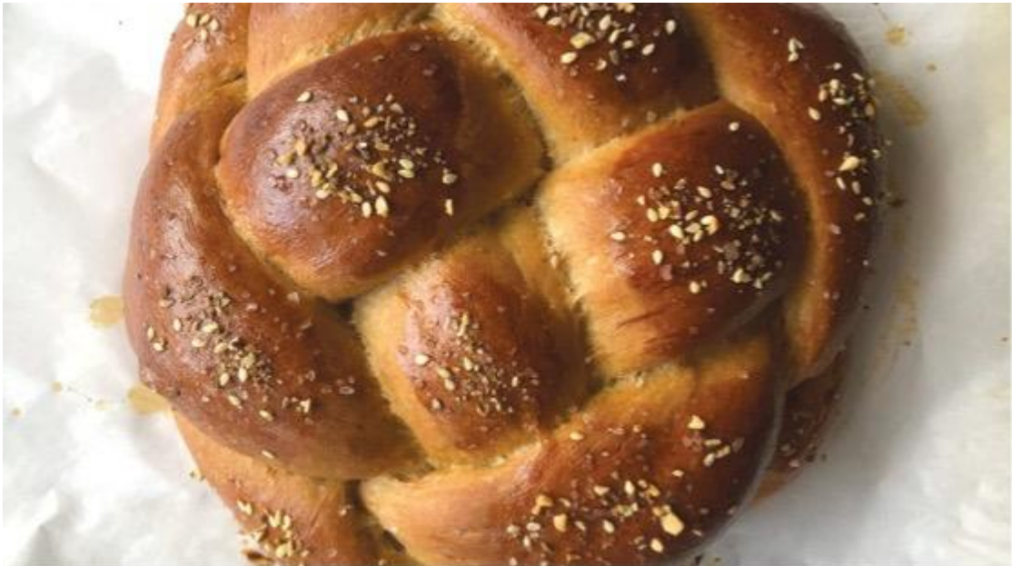
哈拉麵包

我發現猶太新年（Rosh Hashanah）吃圓形哈拉麵包（challah）的主要原因，其實與歷史上的第一對「親屬」（夫妻）亞當和夏娃有關。