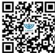
CANWF 官方網站 完整資訊都在這 (可到網站下方 訂閱免費電子報)