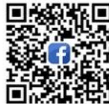
CANWF Facebook 不錯過即時消息與影片