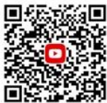
CANWF YouTube 觀看最新影音新聞、今日以色列影片