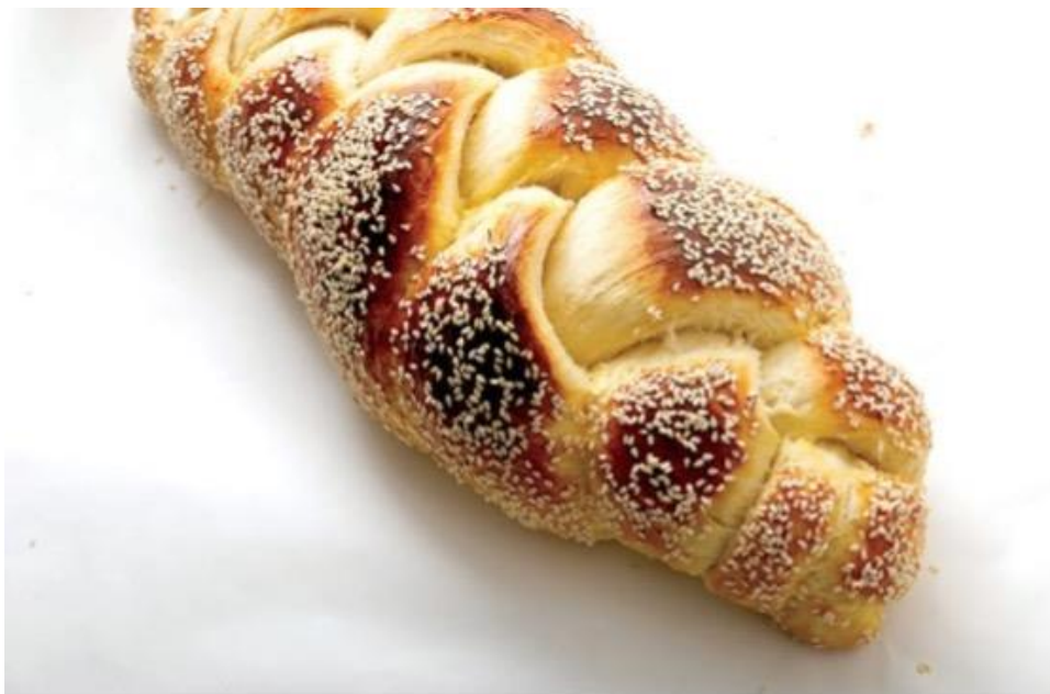
安息日的哈拉麵包

經過幾十年週復一週的反覆編織，製作哈拉麵包的師傅的技術已經非常熟練，無論是六股還是一股，其實所需時間差不多。專業烘焙師甚至在凌晨兩點被叫醒時，閉著眼睛都能完成哈拉麵包的製作。（我妻子真的在我身上測試過這一點！）