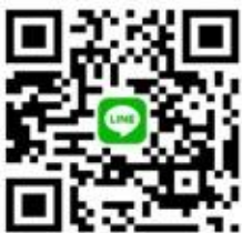
CANWF Line@ 每週以色列新聞及代禱消息