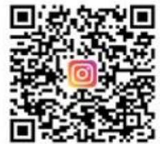
CANWF Instagram 以色列生活大小事、 節日卡片、經文圖與您分享