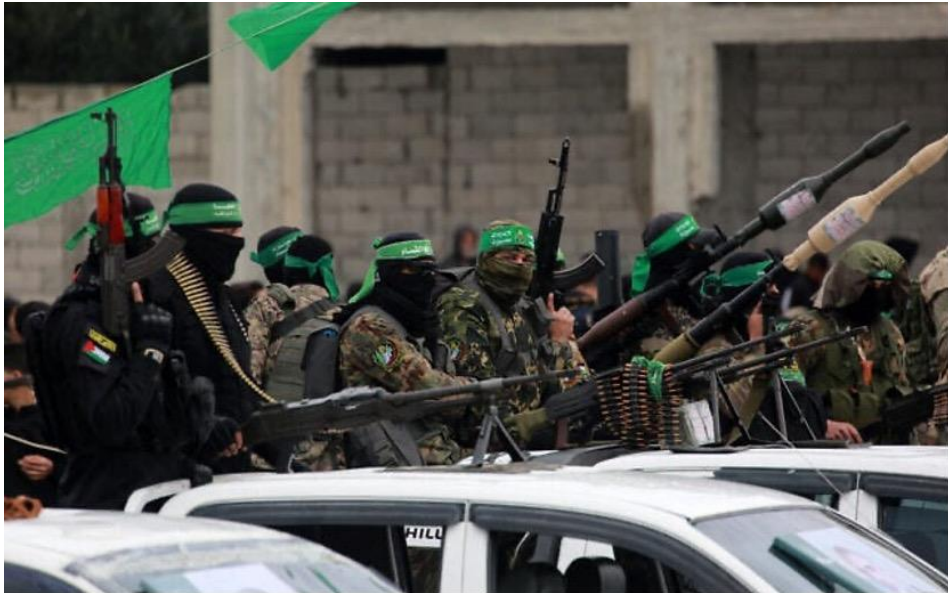
圖說：2025 年 2 月 22 日，以色列人質獲釋前，哈馬斯恐怖份子在加薩走廊中部的努塞拉特（Nuseirat）攜帶槍枝。

該恐怖組織還表示，任何根據納坦雅胡提案組成的執政機構都將被視為「與以色列關聯的佔領勢力」。