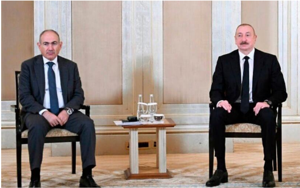
亞塞拜然總統伊爾哈姆·阿利耶夫（Ilham Aliyev，右）與亞美尼亞總理尼可爾·帕希尼揚（Nikol Pashinyan）在阿拉伯聯合大公國阿布達比會談前合影，攝於 2025 年 7 月 10 日。

消息人士表示，儘管川普政府官員公開提出多個可能加入協議的國家，但以亞塞拜然為中心的會談，是目前結構最完整以及最為認真的對話。其中兩位受訪者甚至認為，這項協議有可能在幾個月內，甚至數週內達成。