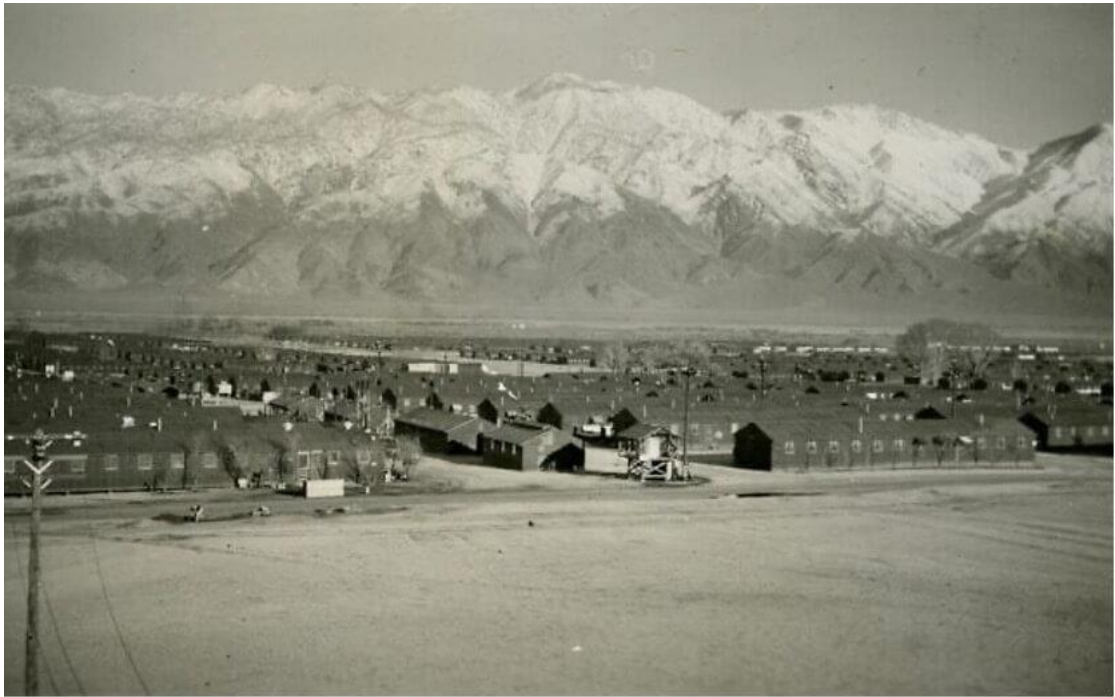
遠眺曼薩納爾。

「然而，大多數人（甚至歷史學家與美國善意的大眾）仍然普遍使用『拘留營』（internment camp）這個詞。但事實上，『拘留』（internment）是指戰時對拘禁外國人的法律術語，所以這些集中營基本上不算是拘留營，因為被關押其中的三分之二是美國公民。這些美國人僅因他們的血統就被趕出家園，以及被囚禁在這些集中營裡。」