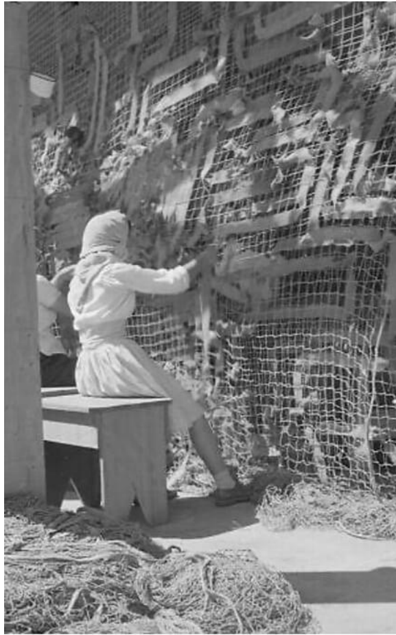
1942 年 7 月，曼薩納爾的偽裝網工廠。