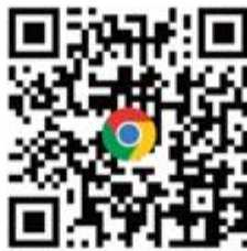
CANWF官方網站 完整資訊都在這 (可到網站下方 訂閱免費電子報)