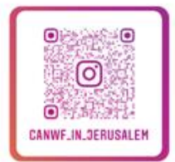
CANWF Instagram 以色列生活大小事、 節日卡片、經文圖與您分享