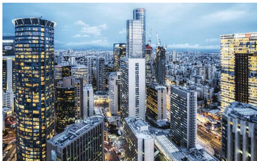
以色列特拉維夫的摩天大樓。