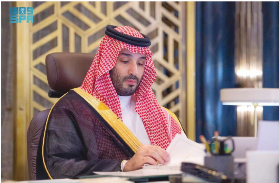
沙烏地阿拉伯王儲穆罕默德·本·薩勒曼（Mohammed bin Salman）

對此， 川普提及美國將向伊朗實施嚴厲的石油出口政策 ，包括致力降低伊朗的石油出口量至「零」， 以阻止伊朗繼續靠所得的收入來製造核武 。然而，川普也拋出「橄欖枝」，表示願意與伊朗進行會談，以要求他們為核武一事讓步。