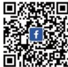
CANWF Facebook 不錯過即時消息與影片