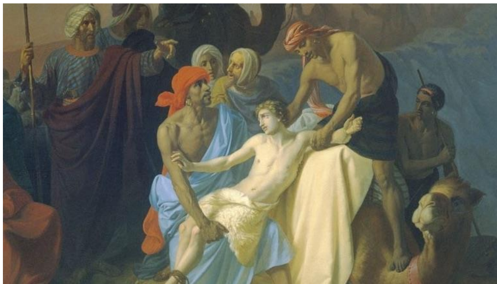
約瑟與加薩人質同時被俘——康斯坦丁·弗拉維茨基 (Konstantin Flavitsky) 1855 年畫作。

最近的一篇文章中，我寫到三名被綁架的年輕女性人質已經回家，感謝神！我在文章中提及這節經文：「童子沒有了。我往哪裡去才好呢？」（創世記 37:30）。