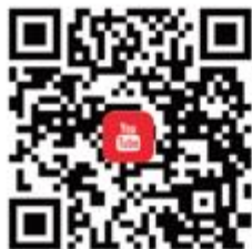
CANWF YouTube 觀看最新影音新聞、今日以色列影片