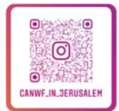
CANWF Instagram 以色列生活大小事、 節日卡片、經文圖與您分享