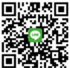
CANWF Line@ 每週以色列新聞及代禱消息