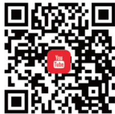
CANWF YouTube 觀看最新影音新聞、今日以色列影片