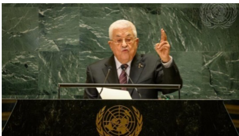
巴勒斯坦自治政府總統馬哈茂德·阿巴斯在聯合國大會上發表演說。

艾德還提美國、加拿大、歐盟以及許多歐洲和中東國家都參與了該會議，以此表示該會議受到大多數國家的承認與支持。