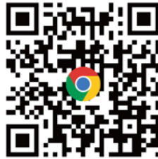
CANWF官方網站 完整資訊都在這 (可到網站下方 訂閱免費電子報)