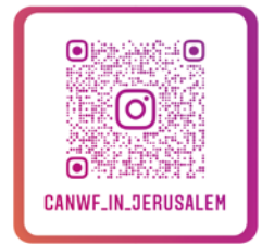
CANWF Instagram 以色列生活大小事、 節日卡片、經文圖與您分享