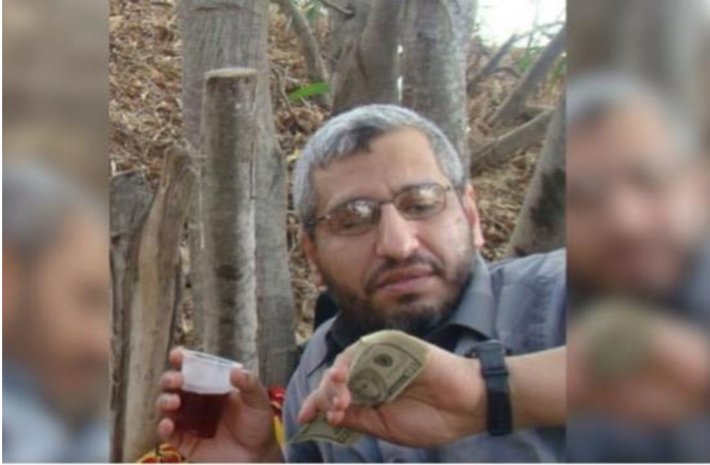
哈馬斯軍事部門負責人穆罕默德·德夫