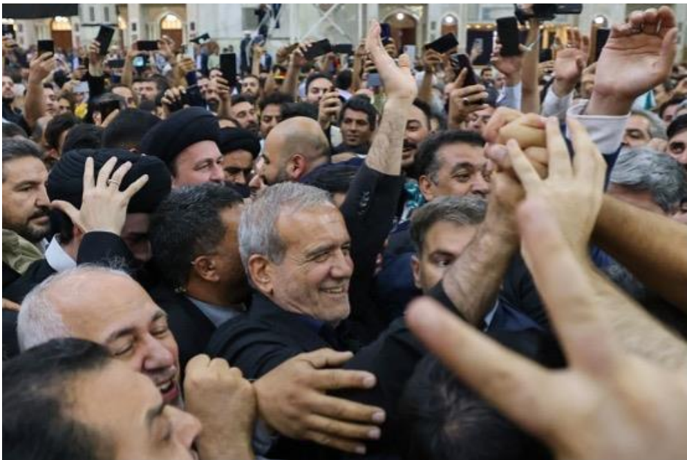
2024 年 7 月 6 日，新當選的總統佩澤什基安被支持者圍繞。

然而，雖然這次選舉的投票率仍低於 50%，但投票的人卻決定反對保守派與極端份子，這使得唯一一名代表「改革派」出戰的佩澤什基安獲得勝利。