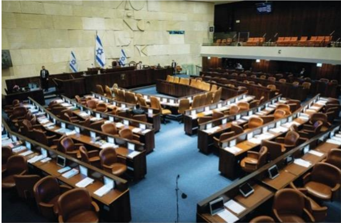
以色列議會。