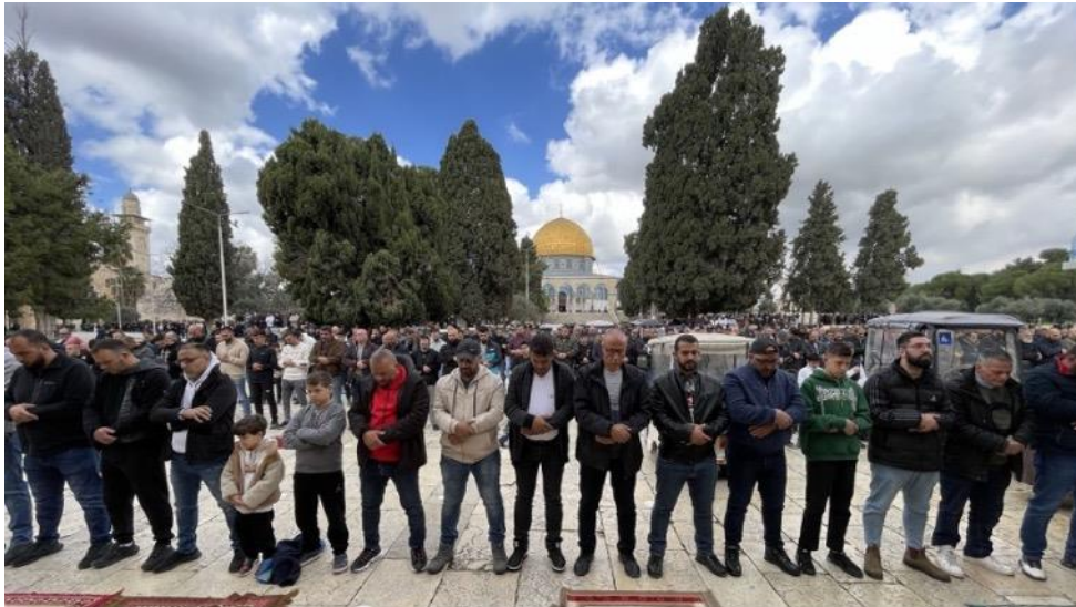
少數巴勒斯坦人週五在阿克薩清真寺大院祈禱。

上週五 ( 3/8 )，美國中央情報局局長比爾·伯恩斯 ( Bill Burns ) 在約旦秘密會見以色列情報局 ( 摩薩德 ) 局長大衛·巴尼亞 ( David Barnea )，為被扣押在加薩的人質達成換囚協議進行討論。以色列情報局在一份罕見的聲明中表示： 「哈馬斯以犧牲加薩地帶的巴勒斯坦居民為代價，試圖在齋戒月期間加劇聖殿山地區的暴力衝突。」以及「哈馬斯拒絕做出讓步，並表示對人質換囚協議不感興趣。」