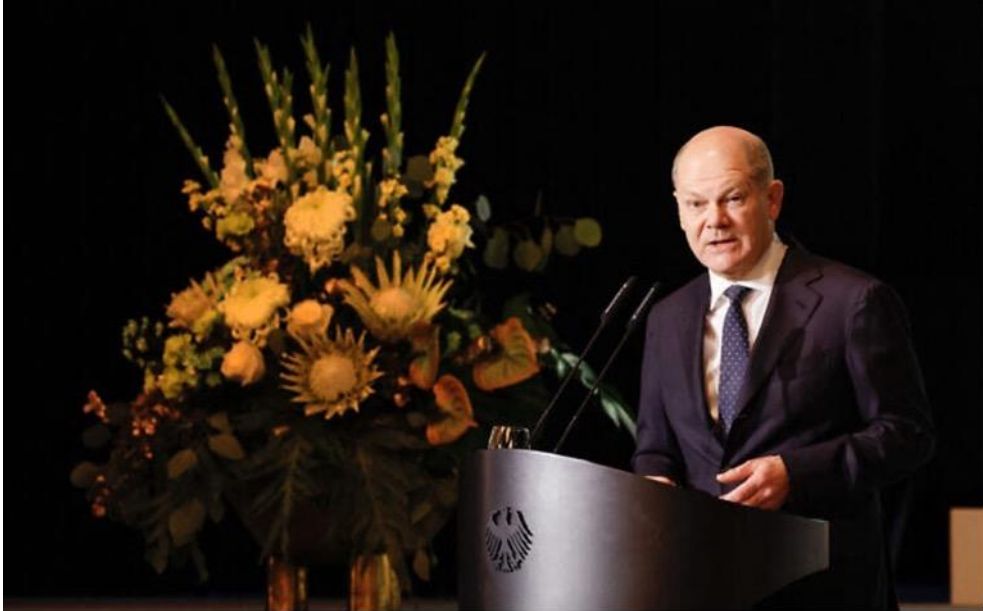
德國總理奧拉夫·蕭茲