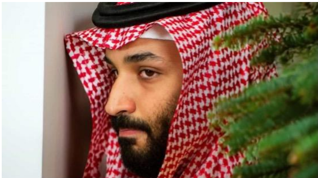
沙烏地阿拉伯王儲 ( Mohammed bin Salman in Riyadh ) 。

歐盟強調「國際人道主義法規定『醫院、醫療用品和醫院內的平民必須受到保護』，但國際法也規定，『如果醫院被用來作為發動戰爭的場所，那麼醫院會失去保護。』」並重申立場，即以色列有權根據國際法和國際人道主義法來捍衛自己。