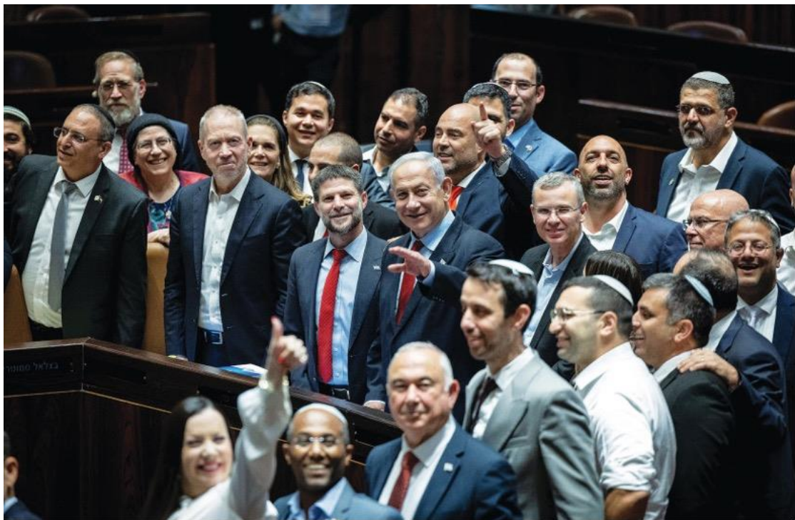
2023 年 8 月 27 日，總理班傑明·納坦雅胡及其聯盟成員慶祝國家預算的通過。

財政部和內政部表示，他們將提供資金和措施來打擊阿拉伯社區的犯罪組織。近期不但有 15-20 位阿拉伯城市的候選人和現任官員受到犯罪組織威脅，自今年年初以來，已有 157 名阿拉伯社區居民死於暴力事件，這一數字是 2022 年同期的兩倍多。這些組織犯罪暴力事件被認為是阿拉伯人謀殺率飆升的原因。斯莫特里赫辦公室表示，財政部將增加以色列警察部門「數千萬謝克爾」的資金，用於優化阿拉伯社區的執法系統和人身安全所需的科技設備和技術，以根除阿拉伯社區的犯罪組織。