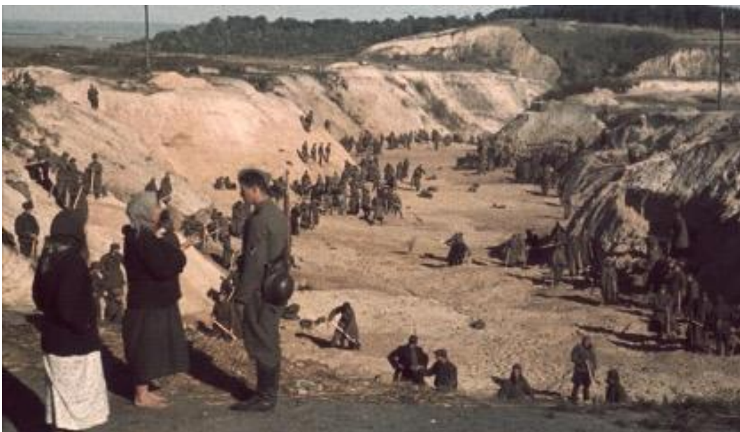
1941 年，蘇聯戰俘們在巴比亞爾的大屠殺遺址掩埋亂葬坑。

在 1939 年德國入侵波蘭並引發第二次世界大戰時，現今烏克蘭的西部地區受到波蘭的控制。這些地區的多數猶太人所遭遇的處境比國家中部和東部的猶太人更加慘重，因為在 1941 年夏季，德國人進軍烏克蘭時，數以十萬計的猶太人向東逃亡。德國人抵達後不久，在基輔郊區的一個叫巴比亞爾 ( Babi Yar ， 註：娘子谷，現在更常稱為巴賓亞爾「 Babyn Yar 」 ) ，他們在短短幾天內射殺並埋葬了三萬三千名猶太人，而這成為戰爭期間最嚴重的大屠殺。類似 ( 但規模較小 ) 的大規模屠殺還發生在利維夫 ( Lviv ) 和敖得薩 ( Odessa ) 。