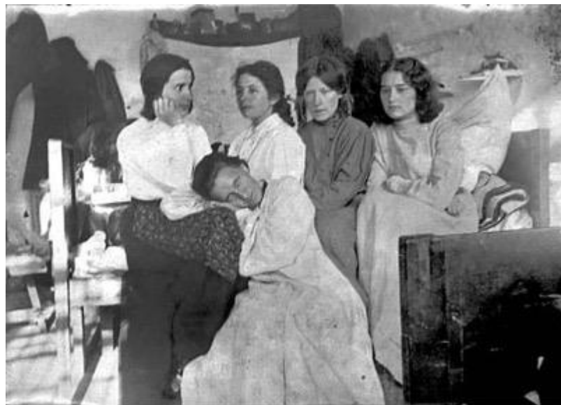
十九世紀的猶太女性。

猶太人最早於十七世紀中期抵達美國，並開始在此生根發展，然而一開始在美國的猶太人並不多，美國獨立（西元 1776 年）時，整個美國大陸只有約兩千五百名猶太人，大多數分布在東海岸地區（尤其是紐約州），直到十九世紀初，從歐洲移居美國的猶太人開始逐漸增加，主要來自德國與匈牙利，還有部分是來自俄羅斯與羅馬尼亞。