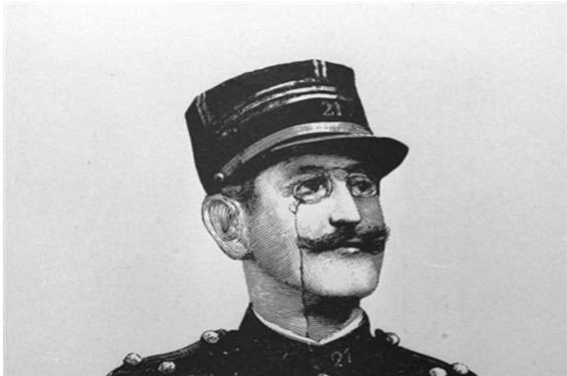
法國反猶主義卡通示意圖。

法，首先是相信種族解釋了人種性格或能力的差異，並認為特定種族（例如：雅利安人種）優於其他種族；其次是基於對其他種族的歧視與偏見。不論是十八世紀的「民族主義」，或是十九世紀的「種族主義」都升溫了自中世紀起就十分昌盛的「反猶」意識，使得大多數流亡居住在歐洲的猶太人，面臨越來越嚴峻的反猶主義行為。