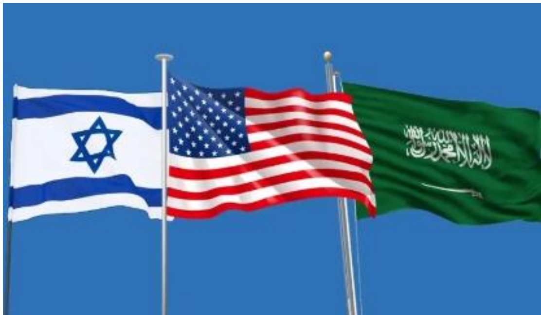
以色列、美國與沙烏地阿拉伯國旗。