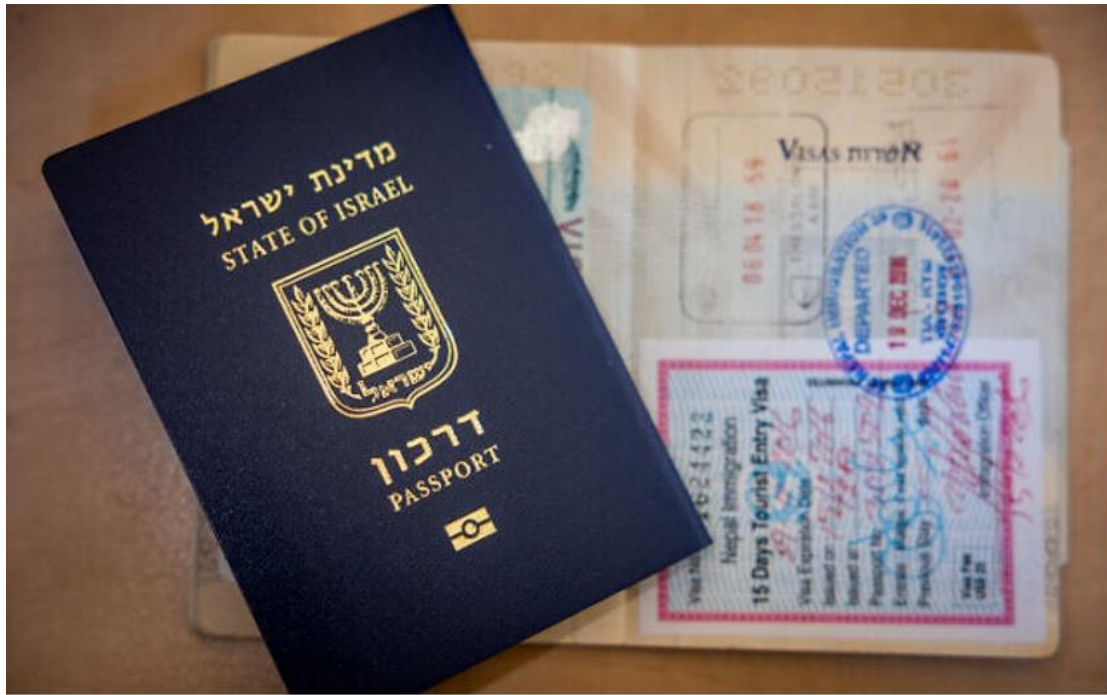
2023 年 1 月 18 日的以色列護照。

數據顯示，63%於 2015 年抵達以色列的移民，和 66%於 2016 年回到以色列的移民至今仍住在以色列。自 2017 年以來，這項數據一直在 61%和 69%間移動