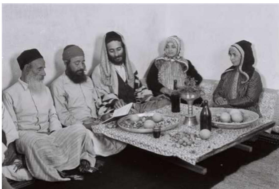
葉門猶太人。

「葉門猶太人」 ( Yemenite Jews )，葉門猶太人指的是過去或者是直到現今居住在葉門的猶太人後裔，他們有著獨特的宗教傳統，將他們與其他猶太社群分別出來，他們也被稱為所有猶太人中「最猶太」的人與將希伯來語保存得最好的人。在葉門，部分猶太人的血統甚至可以追溯至猶大 ( Judah )、便雅憫 ( Benjamin )、利未 ( Levi ) 與呂便 ( Reuben )，葉門猶太人有三大主要群體：巴拉迪族 ( Baladi )、沙米族 ( Shami ) 以及邁蒙尼教派 ( Maimonideans，註：深受邁蒙尼德作品影響 )。