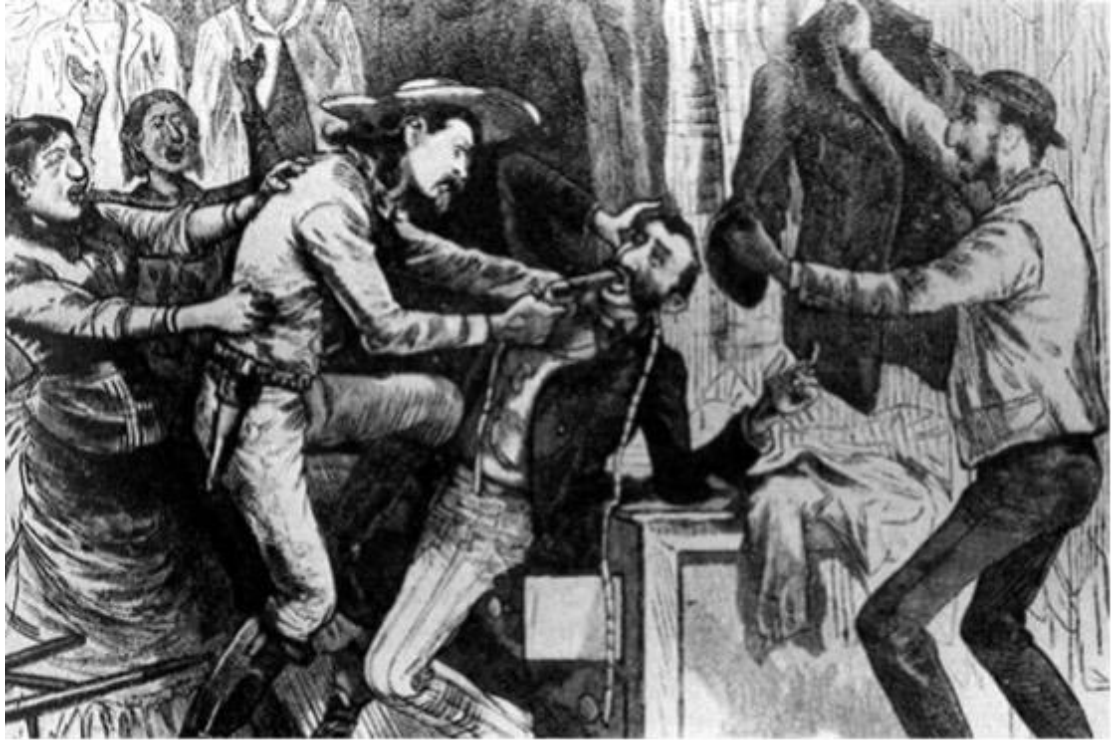
十九世紀反猶主義繪畫中被牛仔威脅的猶太人。