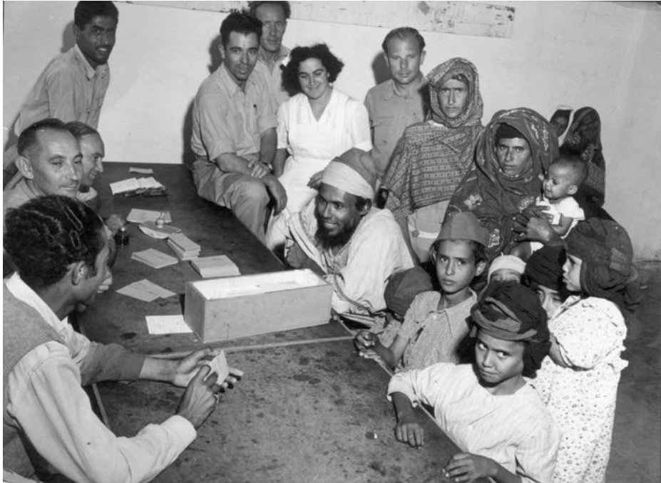
米拉茲希猶太人。

中世紀時，除了「阿什肯納茲猶太人」（除地中海一帶外的歐洲猶太人，大多屬於阿什肯納茲猶太人）與「塞法迪猶太人」（祖籍在伊比利半島，守著猶太傳統的西班牙裔猶太人）外，還有經常被與塞法迪猶太人搞混的「米茲拉希猶太人」（Mizrahi Jews），米茲拉希猶太人指的是西亞與北非猶太社區的後裔，例如來自於伊拉克、庫德族（Kurdish）、黎巴嫩、敘利亞、土耳其、伊朗、埃及、利