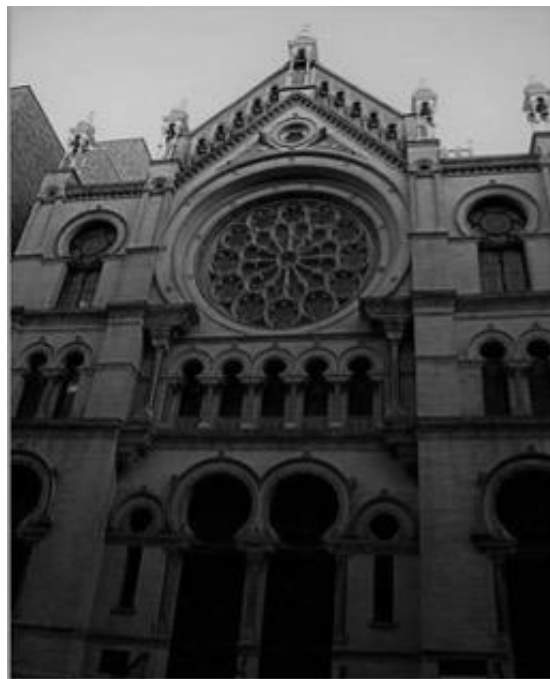
紐約的第一座宜猶太會堂。

儘管中世紀時，英國是歐洲第一個徹底實施排猶政策的國家，但至 17 世紀中葉後，宗教寬容與自由主義成為社會的主流風氣，英國自此成為許多猶太人湧入發展的國家，迎來許多受到西班牙宗教迫害的猶太人，此外英國在北美殖民地的政策也相對寬鬆，所以來自英國的猶太人也有部分移居至北美洲，並在 1695 年建立北美第一座猶太會堂。