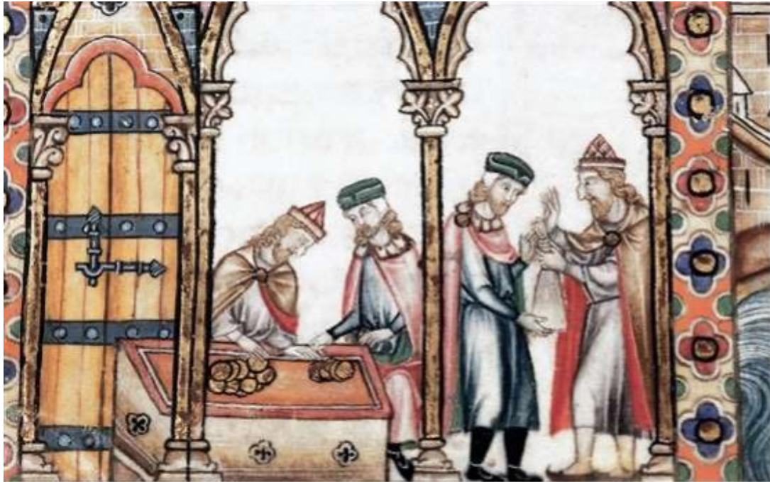
13 世紀猶太人銀行家示意圖。