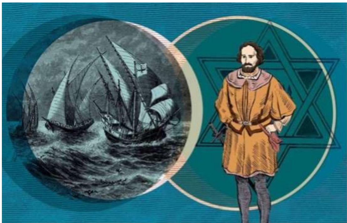
哥倫布示意圖。

15 世紀時，航海業的發展促成了地理大發現（地理大發現），知名大航海家「哥倫布」（Christopher Columbus）