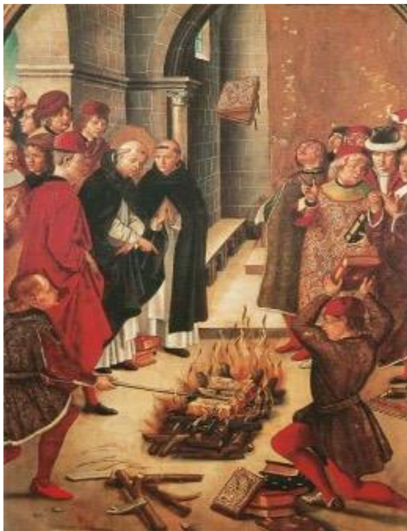
描繪天主教徒在西元 1242 年焚燒塔木德副本。

對猶太人的怨恨除了經濟上的因素與宗教的偏見，促使猶太人從一些地區被強制驅逐，包含英國（西元 1290 年）、法國（14 世紀）、德國（1350 年代）、葡萄牙（西元 1496 年）、普羅旺斯（西元 1512 年）與教宗國（西元 1569 年，The Papal States，註：「教宗國」是南歐已不存在的國家，過去為教宗統治的領地，位於義大利半島中部）。