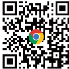
CANWF 官方網站 完整資訊都在這 (可到網站下方 訂閱免費電子報)