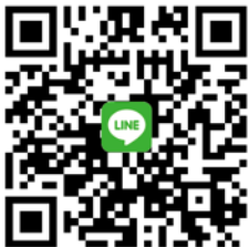
CANWF Line@ 每週以色列新聞及代禱消息