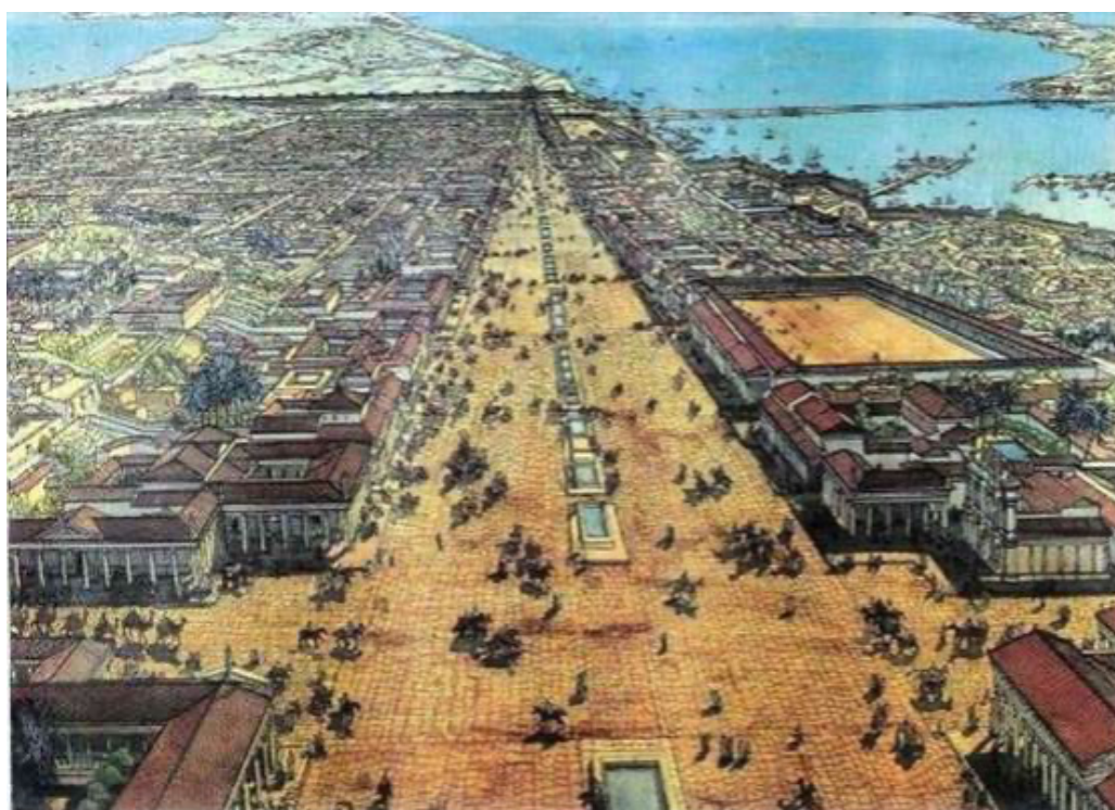
托勒密一世時期，亞歷山卓城市示意圖。

早在西元前四世紀時，部分猶太士兵已被波斯人帶去派駐在埃及地，當時猶太士兵攜家帶眷前往埃及，並在埃及許多城鎮建立了猶太人定居點。之後馬其頓王國接替了波斯王國，亞歷山大大帝在西元前 332 年佔領埃及，於埃及建立了地中海旁重要的運輸港口城市「亞歷山卓」（Alexandria）。亞力山大大帝逝世後，由托勒密王朝接續王權，托勒密一世（Ptolemy I Soter）又將十二萬猶太俘虜從耶路撒冷與撒瑪利亞等地區帶往埃及，除了被強迫擄去的猶太人外，也有許多百姓被肥沃的埃及土地吸引，自願成為移民，於是埃及開始出現了大規模的猶太人定居點，此時亞歷山卓已成為早期猶太歷史中規模最大的猶太定居點。西元前一世紀，估計當地人口約有 40% 為猶太人（估計至少有數十萬人）。