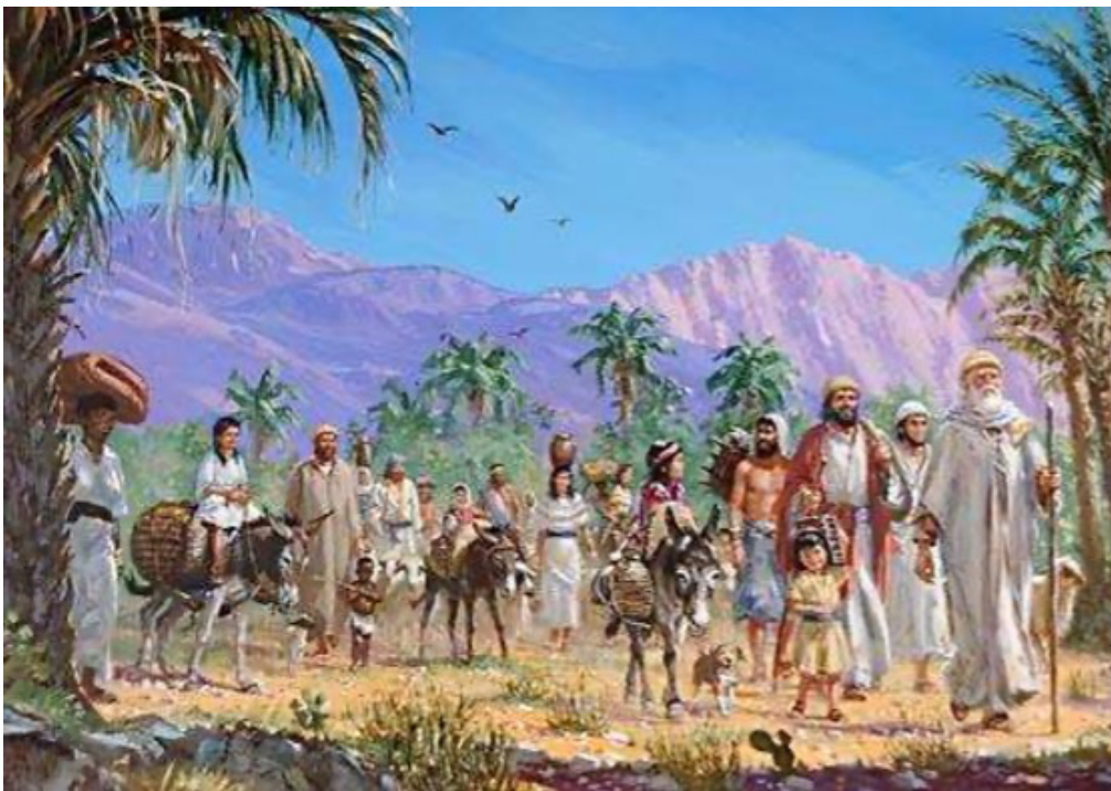
猶太人第一次回歸示意圖。

自西元前 536 年（當時改朝換代為波斯王「古列」作王，也就是居魯士二世）時，古列王允許猶太人返回家園，當時約有五萬名猶太人回歸猶大，但仍有一部份猶太人自願留在巴比倫。根據聖經以斯拉記與哈該書記載，約在西元前 520 年，猶太人回到以色列地後，開始聖殿重建的工程，直至西元前 516 年，聖殿部分重建的工程完畢。