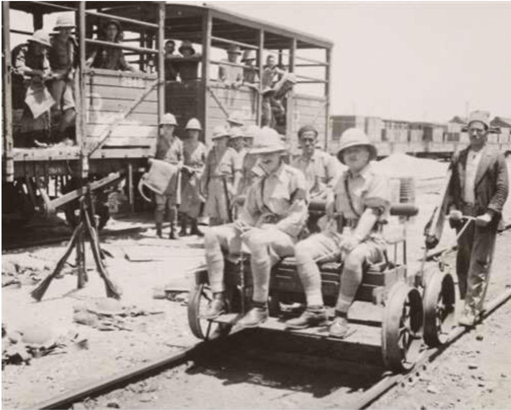
西元 1936 年，英國軍隊在海法。

西元 1920 年，猶太移民在巴勒斯坦建立了錫安主義軍事組織「哈加納」（Haganah，以色列國防軍的前身），該組織的成員被分散部署在巴勒斯坦託管地的各基布茲（Kibbutz，註：以色列的集體社區）中，為的是保衛猶太人遭受阿拉伯人的攻擊。當時巴勒斯坦地區為英國所託管，英國當局不喜歡哈加納，導致哈加納常遭受英國政府的取締，卻也無法除掉哈加納的存在，直到二戰結束時，英國限制移民至巴勒斯坦的猶太人數量的後，哈加納開始向英國政府進行暴力行動。除了哈加納外，亦有從哈加納分支出去較為極