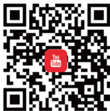
CANWF YouTube 觀看最新影音新聞、今日以色列影片