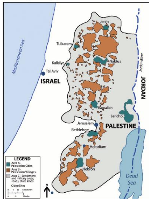
Oslo II Map Outlining Areas A, B, and C

奧斯陸協議劃分的約旦河西岸，傑寧為北方被分給巴勒斯坦自治政府管轄的 A 區。