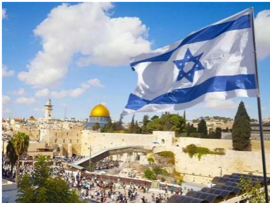
耶路撒冷與飄揚的以色列國旗。

兩千多年前，自以色列南北國分裂並滅亡之後，猶太人彷彿被趕散般，一路從以色列向東、向西、向北又向南的分散在全球五大洲七大洋裡，然而正如神在聖經上所應許的一樣，現在他們被帶回原本遭驅逐出的本地 - 「應許之地」。