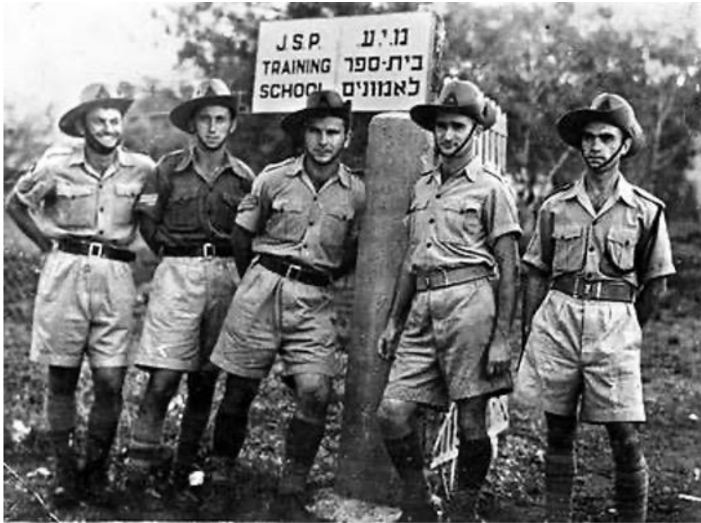
西元 1942 年的哈加納。

端的右翼錫安主義軍事組織「伊爾貢」（Irgun），因著長期遭受阿拉伯人的欺壓，而發動針對阿拉伯人的幾次恐怖攻擊。