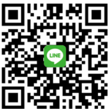
CANWF Line@ 每週以色列新聞及代禱消息