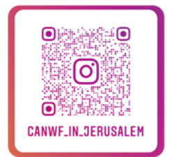
CANWF Instagram 以色列生活大小事、 節日卡片、經文圖與您分享