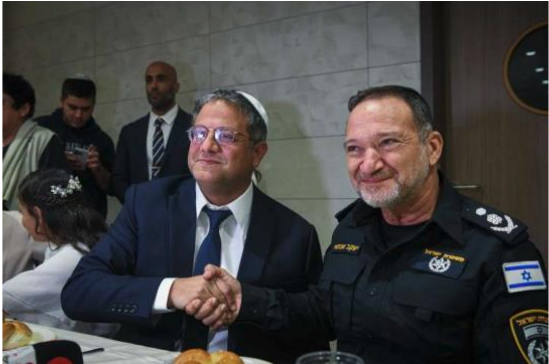
伊塔馬爾·本—格維爾和警察局長柯比·沙布泰對著鏡頭微笑。

上週末本—格維爾的猶太力量黨 ( Otzma Yehudit ) 的議員們警告沙布泰，如果他不服從命令，將會被免職，而沙布泰表示他不會辭職。該聲明似乎標誌著警察局長與其部長間的權力之爭再加劇惡化。上週本—格維爾抨擊耶路撒冷警方未出動足夠的警力鎮壓左翼反政府的示威，同時還批評警察驅逐了在撒瑪利亞一處未經以色列政府授權的猶太人定居點和其果園的行動。